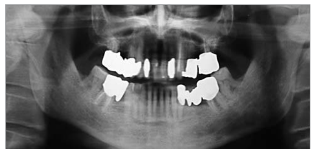
Abb. 3: Panoramaschichtaufnahme vom 15.2.1985.