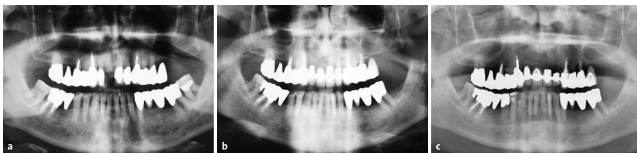
Abb. 4a: Panoramaschichtaufnahme 1989 (drei Jahre nach APT). – Abb. 4b: Panoramaschichtaufnahme 2005 (19 Jahre nach APT). – Abb. 4c: Panoramaschichtaufnahme 2012 (26 Jahre nach APT).

im Sinne überstehender Kronenränder an 17, 24, 37 und 47 sowie Verschattungen im Sinne von Wurzelfüllungen an 15, 23, 27 und 47 jeweils ohne periapikale Aufhellungen zu erkennen.