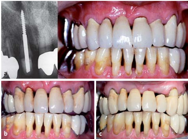
Abb. 5a: Einzelzahnfilm 1989 und intraorale Ansicht nach transdentaler Fixation 11 und neuer Einzelzahnkrone. – Abb. 5b: Intraorale Ansicht 2005. – Abb. 5c: Intraorale Ansicht 2012.

zeigte die Panoramaschichtaufnahme gegenüber dem Ausgangsbefund keinen klinisch relevanten weiteren Knochenabbau.