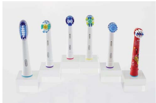
Abb. 1: Der richtige Bürstenkopf für jeden Patienten: Alle gängigen Aufsätze von Oral-B passen auf sämtliche oszillierend-rotierende Oral-B-Handstücke.

ratungsgespräch – verbunden mit einer Empfehlung von individuell geeigneten Hilfsmitteln. Im Vordergrund steht naturgemäß die Zahnbürste, wobei ein elektrisches Modell für die Mehrzahl der Patienten von Vorteil ist. So zeigen viele klinische Studien die Überlegenheit der elektrischen Zahnbürste mit kleinem, runden Bürstenkopf, die geometrisch genau definierte oszillierende Rotationsbewegungen ausführt. In Kurz- bzw. Langzeitstudien wurden für diese eine gründlichere Plaqueentfernung bzw. eine bessere Gingivitisreduktion als für die Handzahnbürste festgestellt. 1,2 Das reichhaltige Angebot an Aufsätzen erlaubt eine auf den einzelnen Patienten zugeschnittene Auswahl (z.B. Oral-B Precision Clean, Oral-B Tiefen-Reinigung, Oral-B 3D White, Oral-B Sensitive, Oral-B Ortho Care Essentials; Abb. 1 und 2).