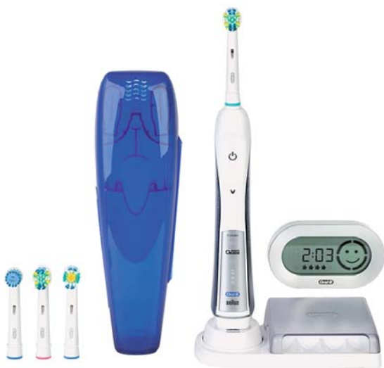
Abb. 2: Alle Studienergebnisse zu oszillierend-rotierenden Elektrozahnbürsten von Oral-B beziehen sich auf das Gesamtsystem Handstück und Original-Aufsteckbürste – hier das Premiummodell von Oral-B: Triumph 5500 mit SmartGuide inklusive verschiedener Aufsätze.

Die am häufigsten angewandte Maßnahme dazu besteht in der täglichen Mundpflege durch den Patienten selbst. Darum bleibt die Motivation für ein konsequentes zweimal tägliches Zähneputzen das A und O im Be-