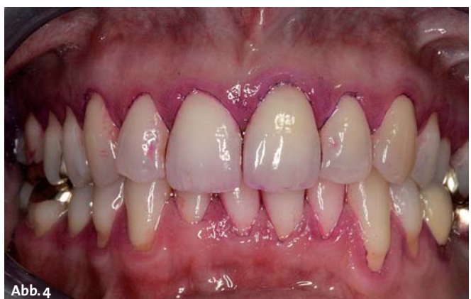
Abb. 1: Die Ausgangssituation. – Abb. 2 und 3: Anfärben der Zähne. – Abb. 4: Der Plaque-Index.