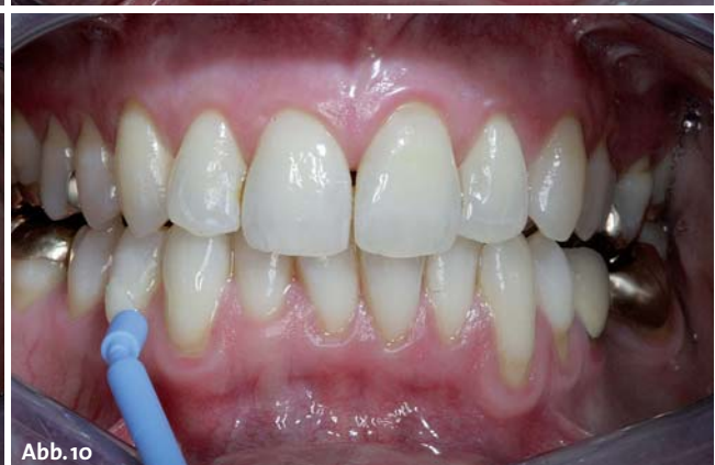
Abb. 5: Die Vorpolitur. – Abb. 6: Die Vorpolitur mit Minibrush. – Abb. 7 und 8: Feinpolitur und Abschlussituation mit dem Reinigungsergebnis. – Abb. 9 und 10: Die Intensivfluoridierung.

Es ist ratsam, sich im Prophylaxeteam auf die Durchführung und Dokumentation eines bestimmten Index zu beschränken, um eine bessere Reproduzierbarkeit gewährleisten zu können. Nach dem Auswerten der Indices (Abb. 4) sollten die Befunde kurz mit der Patientin besprochen werden. Eine intraorale Kamera oder ein Handspiegel mit Vergrößerungseffekt können hierbei unterstützen und behilflich sein.