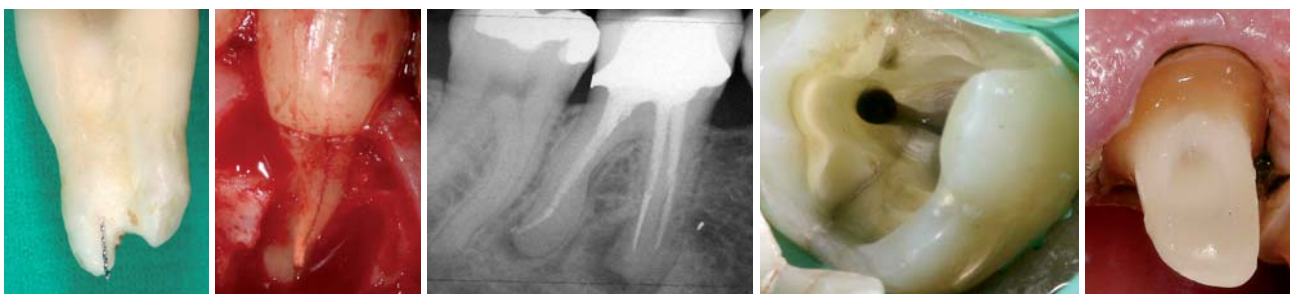
Abb. 1: Endometrie ist unabdingbar für die korrekte Arbeitslänge. – Abb. 2: Längsfraktur. – Abb. 3: Fall 1: Röntgenbild Ausgangszustand vor Revision. – Abb. 4: Querfraktur (anderer Fall). – Abb. 5: Ferrule Design.

Die intraorale Inspektion ergab keine solitären parodontalen Defekte bei der zirkumferenten Sondierung, sodass zunächst eine Längsfraktur ausgeschlossen werden konnte. Folgende Aspekte sind im Vorfeld zu berücksichtigen und zu klären, ob ein Zahn langfristig erhalten werden kann: