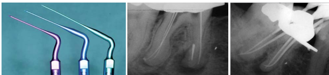
Abb. 6: Ultraschallansätze zur Entfernung von Fragmenten. – Abb. 7: Freilegung des Fragments und Instrumentierung und Durchgängigkeit aller Kanalsysteme. – Abb. 8: Masterpointaufnahme; periapikal alte WF nicht entfernbar.