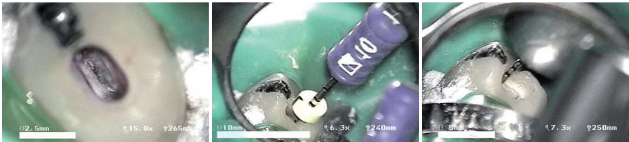
Abb. 4: Zugangskavität mit obliterierten Kanaleingängen. – Abb. 5: Bestimmung der Arbeitslänge mit Profinder 010. – Abb. 6: Rotierende Erweiterung des Gleitpfades mit PathFiles.