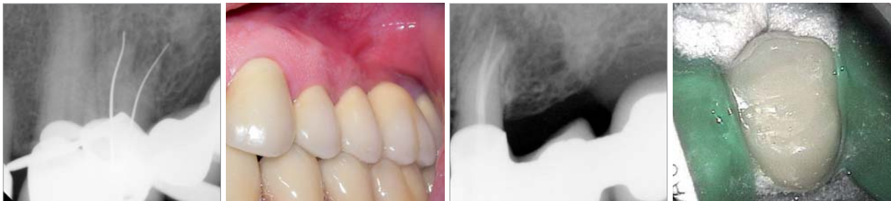
Abb. 7: Röntgenmessaufnahme mit Silberstiften. – Abb. 8a: Fistel nach zehn Tagen geschlossen. – Abb. 8b: Röntgenkontrolle nach Wurzelkanalfüllung. – Abb. 8c: Verschluss der Zugangskavität mit Komposit.

Zahn wies keine Lockerung auf und auch die Taschentiefen waren klinisch unauffällig. Es gab kein Anzeichen für eine bestehende Fraktur. Die angefertigte Röntgenaufnahme mit einem Guttaperchastift im Fistelgang zeigt eine apikale Parodontitis am Zahn 24 als Ursache für die Fistel (Abb. 3). Nach Aufklärung und Besprechung der Therapiealternativen wurde beschlossen, den Zahn unter Erhalt der vorhandenen prothetischen Versorgung orthograd endodontisch zu behandeln.