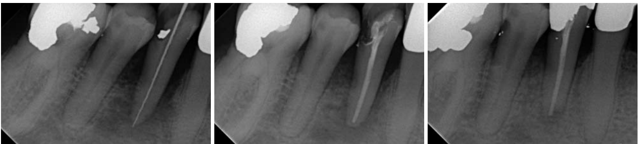
Abb. 4: Messaufnahme von Zahn 44 mit deutlichem apikalem Befund. – Abb. 5: Kontrollaufnahme von Zahn 44 nach der Wurzelfüllung. – Abb. 6: Endkontrolle von Zahn 44 ca. vier Monate nach Abschluss der Wurzelbehandlung mit ausgeheiltem apikalem Befund.