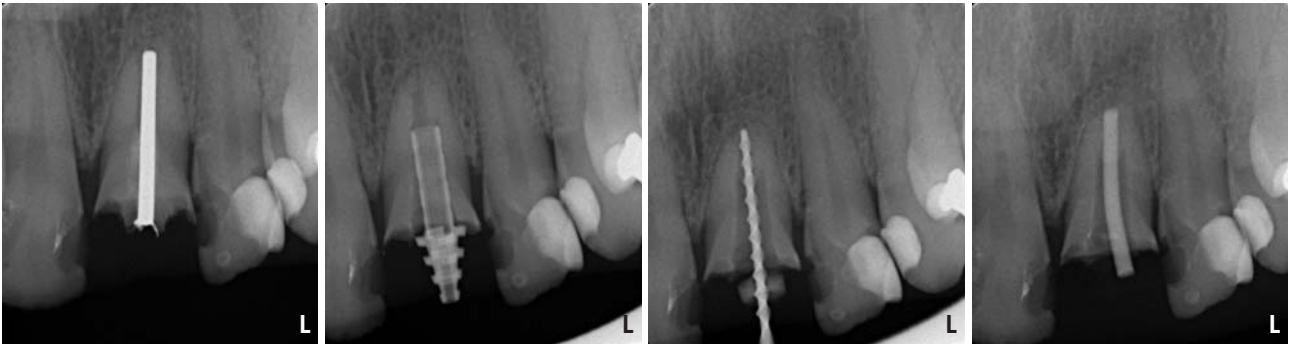
Abb. 7: Ausgangsbefund nach Zahn- und Stiftfraktur (Silberstift) von Zahn 21. – Abb. 8: Kontrollaufnahme mit provisorisch eingesetztem Stift (RepairPost, Fa. KOMET/GEBR. BRASSELER, Lemgo) nach Umbohrung und Entfernung des Silberstiftes. – Abb. 9: Messaufnahme von Zahn 21. – Abb. 10: Masterpointaufnahme von Zahn 21.