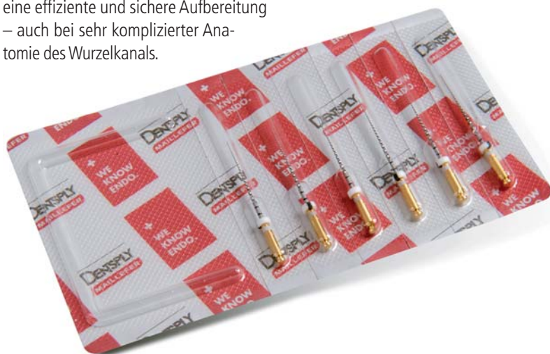
Abb. 6: Stets mit optimaler Schneidleistung, hoher Sicherheit und ohne das Risiko einer Kreuzkontamination: Gleitpfad-Feilen im vorsterilisierten Blisterpack für den Ein-Patienten-Gebrauch.

Einen zusätzlichen Fortschritt brachten in den vergangenen Jahren neue Feilengeometrien mit sich. Bewährt haben sich bei den kontinuierlich arbeitenden maschinengetriebenen Feilen unter anderem ein rechteckiger, exzentrischer Querschnitt im Schneidbereich und eine schlängelnde Feilenbewegung (PROTAPER NEXT, DENTSPLY Maillefer, Ballaigues) – für einen effektiven Schutz gegen Verblockung und einen effektiven Abtransport von Debris zur Zugangskavität. Die Schneidkraft verteilt sich auf nur zwei Schneidkanten, was ein zeitsparendes und sicheres Arbeiten ermöglicht. Dies sichert eine hohe Flexibilität in jeder klinischen Situation, auch bei stark gekrümmten Wurzelkanälen oder Via falsa.