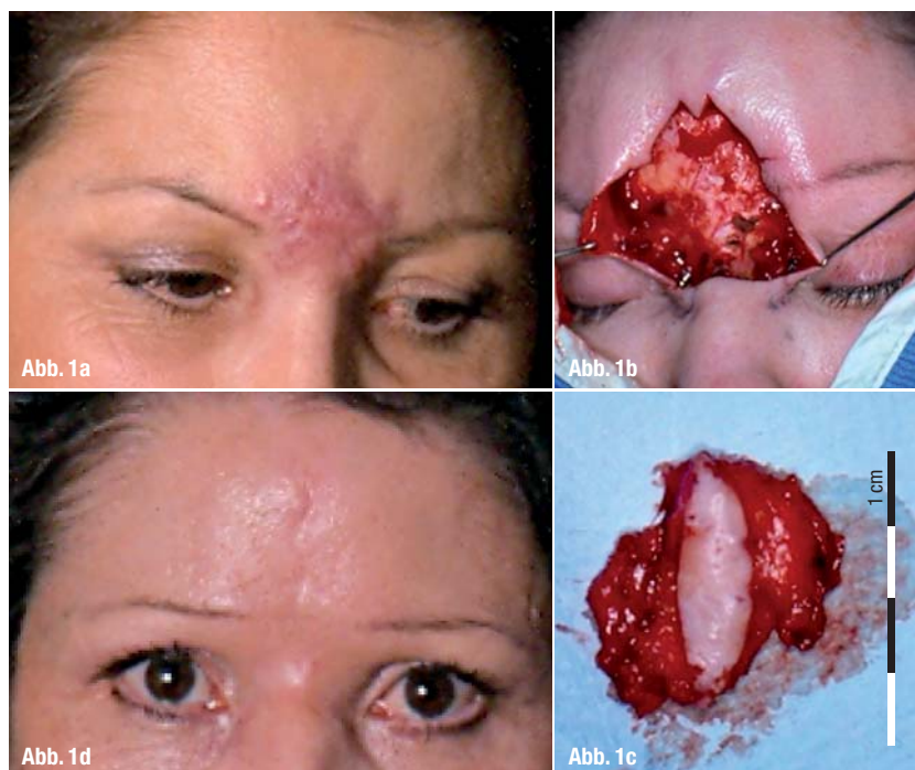
Abb. 1a _ Silikonom bei einer 50-jährigen Patientin, aufgetreten neun Jahre nach Injektion.