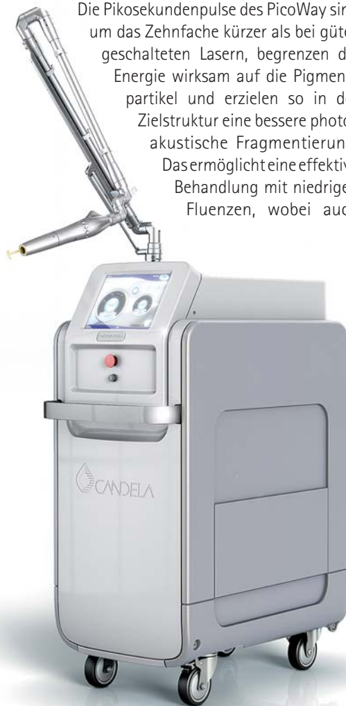
Abb. 1: Die dualen Wellenlängen ermöglichen die Behandlung einer Vielfalt pigmentierter Läsionen und verschiedener Farben und Arten von Tattoos.

Die Pikosekundenpulse des PicoWay sind um das Zehnfache kürzer als bei gütegeschalteten Lasern, begrenzen die Energie wirksam auf die Pigmentpartikel und erzielen so in der Zielstruktur eine bessere photoakustische Fragmentierung. Das ermöglicht eine effektive Behandlung mit niedrigen Fluenzen, wobei auch