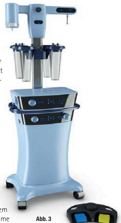
Abb. 3: VASER 2-System mit integrierter Infiltrations-, Ultraschall und Absaugereinheit sowie kabellosem Fußpedal.

Eine detaillierte Antwort konnten wir im Rahmen unserer Validierungsstudie erarbeiten, die in Zusammenarbeit mit Cytori und der Swiss Stem Cell Foundation (SSCF) durchgeführt wurde und zur wissenschaftlichen Publikation ansteht. Wir haben hierbei VASER-Fett mit dem „Goldstandard“ der manuellen Fettentnahme