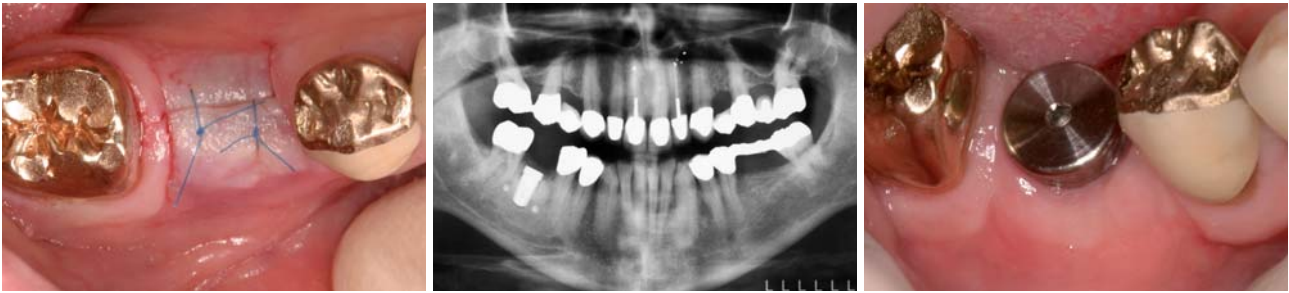
Abb. 8: Naht nach Implantation. – Abb. 9: Kontrollaufnahme OPG nach Implantation. – Abb. 10: Gingivaformer, zylindrisch, ein Monat in situ.