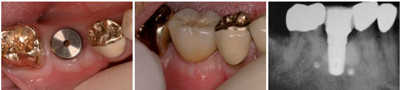
Abb. 23: Gingivaformer und Weichteile vor dem Einsetzen der Krone. – Abb. 24: Metallkeramikkrone in situ direkt nach dem Einsetzen. – Abb. 25: OPG-Kontrollbild nach Eingliederung der Krone.