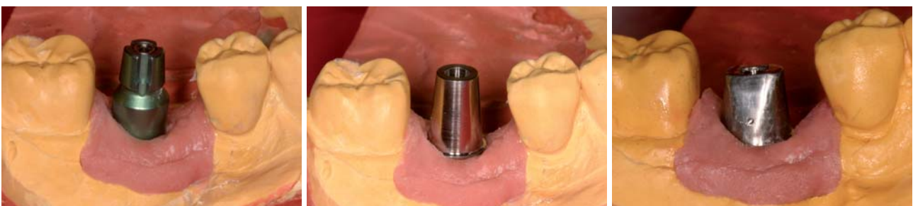
Abb. 17: Meistermodell mit Zahnfleischmaske. – Abb. 18: Das noch unbearbeitete Titanabutment. – Abb. 19: Das individualisierte Titanabutment.