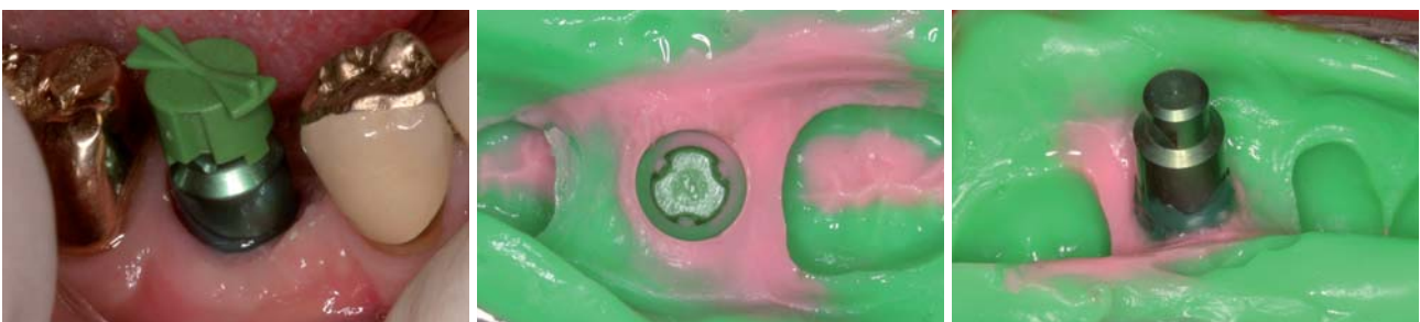
Abb. 14: Abformpfosten, geschlossener Löffel, mit aufgesetzter Repositionshilfe. – Abb. 15: Einblick in die grün farbkodierte Repositionshilfe. Nach apikal grenzt an die Repositionshilfe das rosa Abformmaterial in korrekter Weise an. – Abb. 16: Das eingebrachte Laborimplantat.

Elf Monate später wurde in Regio 46 ein CAMLOG® SCREW-LINE Implantat, Durchmesser 6,0 mm, Länge