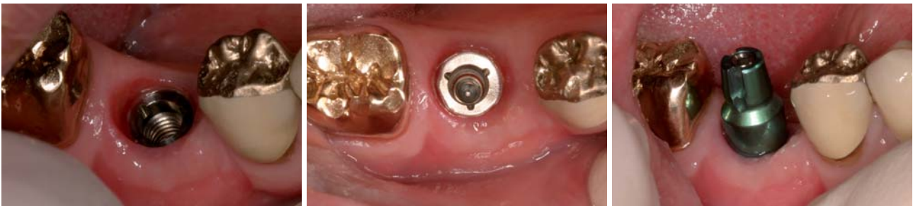
Abb. 11, 12: Weichteilkontur um das Implantat nach Abnahme der Einheilkappe. – Abb. 13: Der eingeschraubte Abformpfosten, geschlossener Löffel.

Schwellung in Regio 46 (Abb. 1). Beim Sondieren konnte eine offene Bifurkation Klasse III diagnostiziert werden. Auf dem Röntgenbild (Abb. 2) war eine große Aufhellung um die Wurzelspitzen erkennbar.