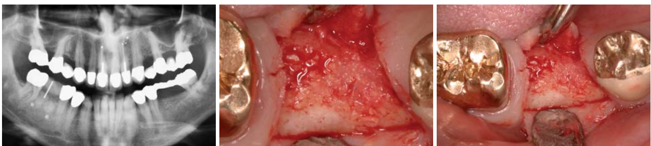
Abb. 5: OPG elf Monate nach GBR mit 11-mm-Mess-Draht. – Abb. 6 und 7: Klinische Situation elf Monate nach GBR.