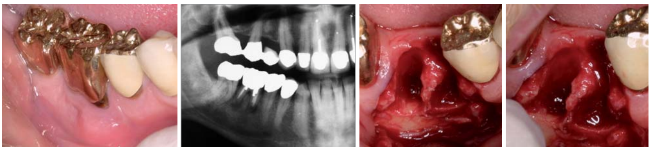
Abb. 1: Klinische Situation vor der Extraktion. – Abb. 2: Röntgenbild vor der Extraktion. – Abb. 3 und 4: Knochenverlust nach Extraktion des Zahnes 46.

17 Jahre nach diesem Befund stellte sich der Patient wiederum mit Beschwerden an Zahn 46 vor. Bei der klinischen Untersuchung zeigte sich eine druckdolente