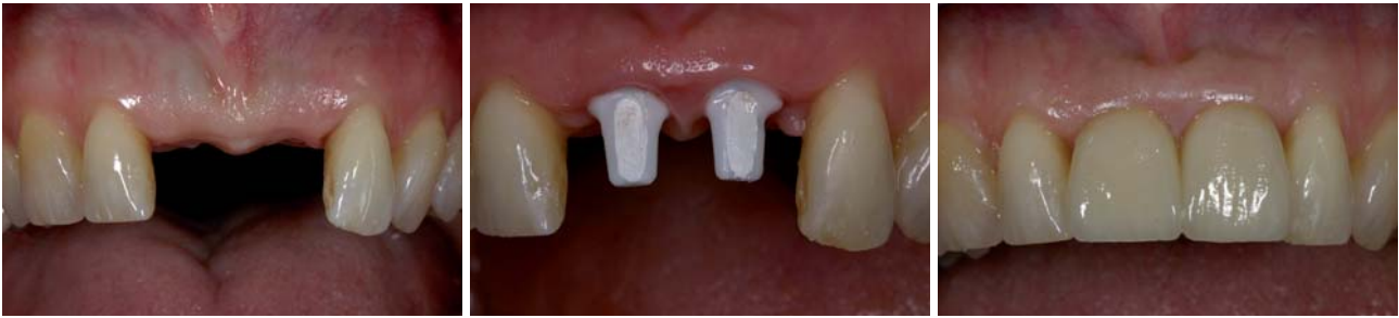
Abb. 5: Ausgangssituation nach Verlust der beiden mittleren Frontzähne. Die Interdentalpapille ist durch die Versorgung mit einem abnehmbaren Interimsersatz weitgehend zerstört. – Abb. 6: Zustand nach umfangreicher Weichgewebsaugmentation und Insertion von zwei Implantaten mit vollkeramischen Aufbauten (Cercon Balance, DENTSPLY Friadent, Mannheim). – Abb. 7: Insertion der vollkeramischen Suprakonstruktion (Cercon smart ceramics, DeguDent, Hanau) mit verlängerter approximaler Kontaktlinie zum Verschluss der approximalen Zwischenräume.

Verbindungen erreicht werden kann, ist ein weiteres positives Konstruktionsmerkmal zum Erhalt der periimplantären Hart- und Weichgewebe. Abgesehen vom Implantatdesign sollten für festsitzende Versorgungen im Frontzahnbereich auch präfabrizierte vollkeramische Abutments auf Zirkonoxid zur Verfügung stehen. Zirkonoxid-Abutments haben eine deutlich höhere Bruchfestigkeit als die schon seit längerer Zeit bekannten Vollkeramikaufbauten aus Aluminiumoxid. Dies reduziert das Risiko einer Abutmentfraktur.