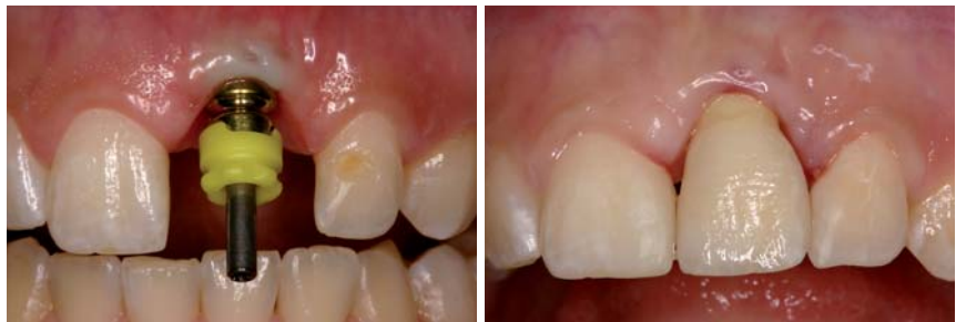
Abb. 1: Falsche Positionierung eines Frontzahn-Implantates mit zu weit bukkal liegendem Durchtrittspunkt und Verlust der vestibulären Knochenlamelle mit Rezession der Weichgewebe. – Abb. 2: Insbesondere im Frontzahnbereich lassen sich Positionierungsfehler nur in geringem Umfang durch die Suprakonstruktion korrigieren. In diesem Fall liegt ein klarer ästhetischer Misserfolg vor.

Eine Vielzahl von ästhetischen Misserfolgen in der Implantologie hat ihren Ursprung in der Planungsphase. Die Planung beginnt mit der Definition des prothetischen Behandlungszieles. Dieses sollte je nach Umfang durch ein Wax-up oder eine provisorische Versorgung simuliert werden. Auf der Basis des prothetischen Behandlungszieles werden dann die Anzahl und Größe der Implantate definiert. Bei der Planung der Implantatposition ist insbesondere der Durchtrittspunkt des Implantates von großer Bedeutung. Eine Divergenz der Im-