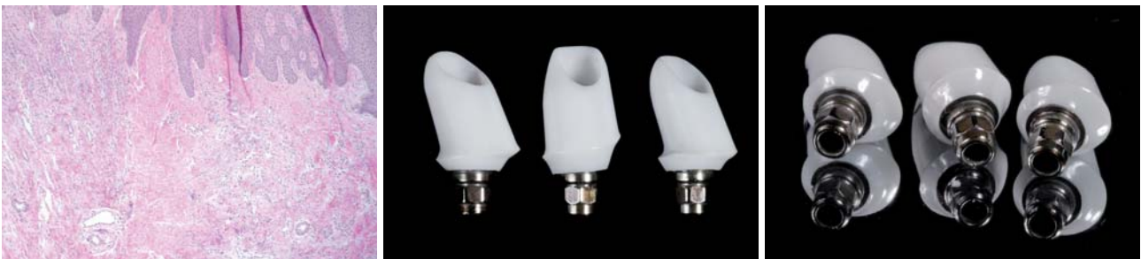
Abb. 1: Pseudo-hemi-desmosomale Weichgewebsstruktur an einem Zirkonabutment (Cercon/XiVE, Fa. DENTSPLY Friudent). – Abb. 2a und b: Individuelle Abutments, Titan-Zirkon gelötet (hotbond Fa. DCM, Aesthetic Base/XiVE, Fa. DENTSPLY Friudent).

Da ich seit mehreren Jahren bereits konsequent mit individuellen Abutments arbeite, kann ich durch klinische Beobachtung und wissenschaftliche Untersuchung bestätigen, dass deren Gestaltung eine gravierende Rolle bei der Herstellung jeder implantatprothetischen Arbeit spielt. Durch moderne CAD/CAM-Techniken ist heutzutage bei der Abutmentindividualisierung eine dreidimensionale Ausdehnung