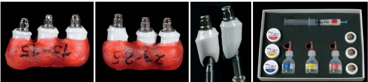
Abb. 3a und b: Jedes Titan-Zirkonabutment ist individuell (Fa. DCM, Rostock). – Abb. 4: Aesthetic Base (XiVE, Fa. DENTSPLY Friudent) Titan mit gelötetem Durchtrittsprofil aus Zirkon (Fa. DCM, Rostock). – Abb. 5: Zirkon hotbond mit Lotsubstanz.