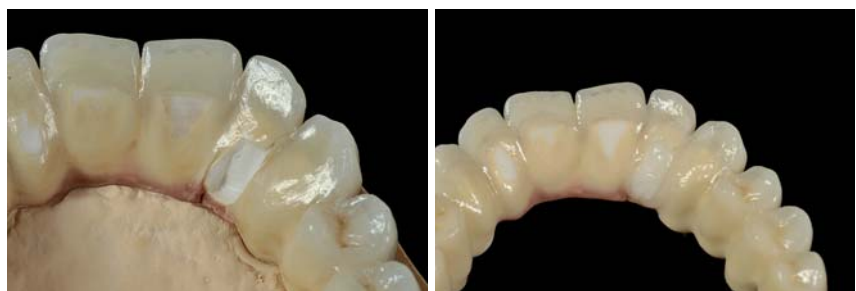
Abb. 11a und b: Mit hotbond gelötete Keramikbrücke nach kompletter Fraktur in Regio 022.