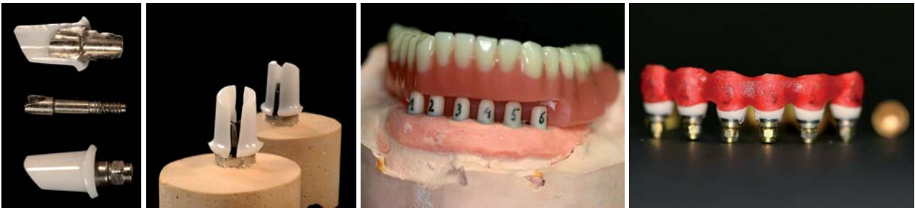
Abb. 8a und b: Titankeramisch gelötetes Abutment. Nach der Lötung wurde das Aesthetic Base Abutment mittig getrennt und unter einem Mikroskop auf Fugendichtigkeit im Bereich der Lötung untersucht. – Abb. 9a und b: Teleskopierende Unterkieferprothese mit Cerabases (Fa. DENTSPLY Friadent, Fa. DCM Rostock) als ideale Abutments.

von Implantatabutments kein Problem mehr. Aus biologischen Gründen ist weiterhin die Verwendung von Zirkon in dem sogenannten Durchtrittsbereich unumgänglich.