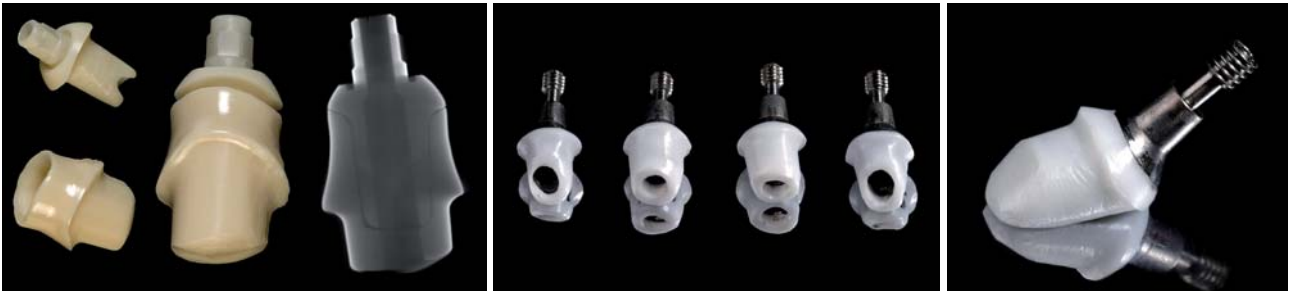
Abb. 6: Cerconabutments (Fa. DENTSPLY Friadent) mit aufgelöteter Sekundärstruktur, emergenzprofiliert. Rechts Darstellung eines Mikrocomputertomogramms. – Abb. 7a und b: Titankeramische Abutments mit Ankylospfosten, jeder ist ein „Einzelstück“ (Fa. DENTSPLY Friadent, Fa. DCM Rostock).