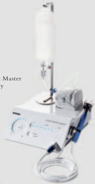
Piezon Master Surgery

EINZIGARTIG in der Welt der Chirurgie – das 3-Touch-Panel zur intuitiven Bedienung.