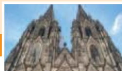
KÖLN 25. 03. 2009