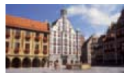
MEMMINGEN (Masterkurs) 26.-27. 06. 2009