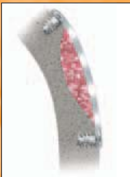
Schalentechnik mit 0,3 mm PLLA-Folie

„Ich arbeite nun seit einem Jahr mit der Schalentechnik. In diesem Zeitraum wurde von mir kein Knochenblock mehr eingesetzt.“