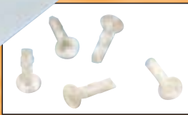
Membrane und Pins aus PLLA