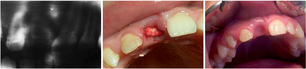
Abb. 7: Zustand präoperativ mit Längsfraktur an Zahn 11. – Abb. 8: Zustand nach Exzision und Augmentierung mit BONITmatrix®. – Abb. 9: Zustand vier Tage postoperativ.

tet und dieser auch dauerhaft vor externen Kontaminationen geschützt sein. 10 Ein weiteres Kriterium für den Erfolg oder Misserfolg einer augmentativen Maßnahme ist in aller Regel von der Revaskularisierung und dem Umbau des Augmentates in vitalen Knochen abhängig. Auch die Qualität des verwendeten Augmentationsmaterials ist ausschlaggebend für den Erfolg einer augmentativen Maßnahme. Beispielsweise sollten die Materialien osseokonduktiv und volumenstabil sein, ein geringes Risiko einer Infektion in sich bergen, eine geringe Antigenität aufweisen, hohe Verlässlichkeit in der Knochenregeneration bieten und letztendlich in ausreichender Menge verfügbar und leicht zu applizieren sein.