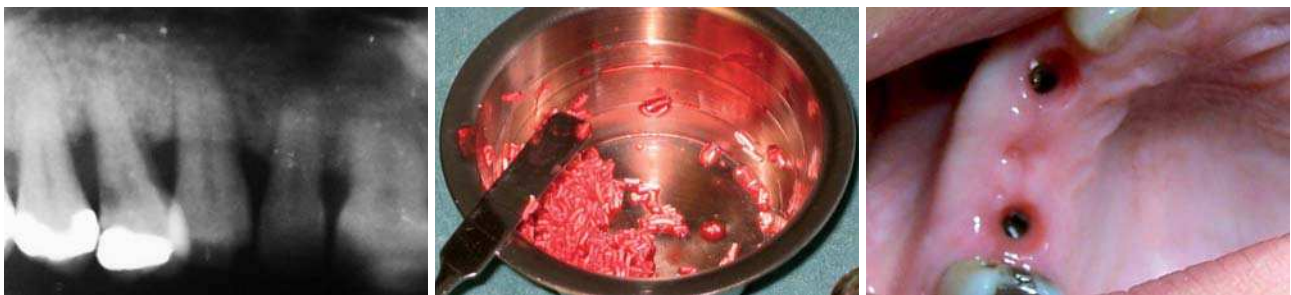
Abb. 1: Zustand präoperativ mit Darstellung der parodontal geschädigten Zähne 13, 14, 15. – Abb. 2: Anmischung des Knochenaufbaumaterials BONITmatrix® mit Eigenblut des Patienten. – Abb. 3: Klinische Situation 14 Tage postoperativ.

und in verschiedenen tierexperimentellen Untersuchungen dargestellt. Araujo et al. fanden beispielsweise heraus, dass nach einer Extraktion sowohl Veränderungen in der horizontalen Kammbreite als auch Veränderungen im krestalen und bukkalen Knochenniveau zu verzeichnen sind. 4 Eine besondere Bedeutung wird der Struktur des Bündelknochens zugeschrieben, der ein Teil des Zahnhalteapparates darstellt. Dieser Bündelknochen ist besonders von den progressiven Resorptionsvorgängen nach Extraktionen betroffen. 5 In der Literatur wurden bereits verschiedene Maßnahmen zur Kammprophylaxe beschrieben, welche die Resorptionsrate des Alveolarfortsatzes deutlich vermindern können. 6,7,8 Eine Möglichkeit, diese Knochenverluste durch augmentative Maßnahmen zu reduzieren bzw. auszugleichen, ist die Methode der Socket Preservation. Sie ermöglicht die Erhaltung der dento-alveolären Strukturen 9 und verhindert damit ein Absinken des Knochenniveaus. Damit eine Augmentation erfolgreich ablaufen kann, sind drei wichtige Voraussetzungen notwendig. Zum einen muss sich das Augmentationsmaterial in einem absolut stabilen und fixierten Raum befinden, weiterhin sollte im Augmentationsbereich eine gute Durchblutung gewährleistet