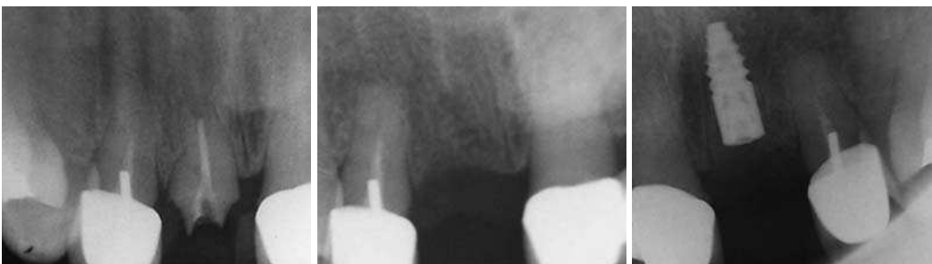
Abb. 10: Zustand präoperativ. – Abb. 11: Zustand nach Exzision von Zahn 21. – Abb. 12: Zustand postoperativ nach Augmentierung und Implantatinsertion in Regio 21.