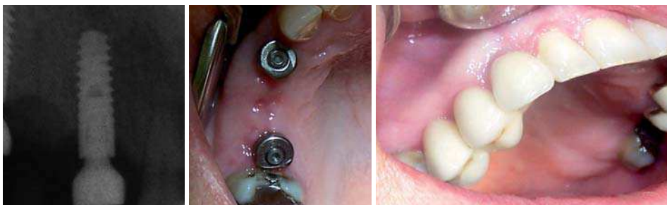
Abb. 4: Zustand drei Wochen postoperativ nach Augmentation und Implantation. – Abb. 5: Zustand vier Wochen postoperativ mit eingesetzten Sulkusformern, Breite des Kieferkammes ist gut zu erkennen. – Abb. 6: Endzustand nach definitiver Versorgung.