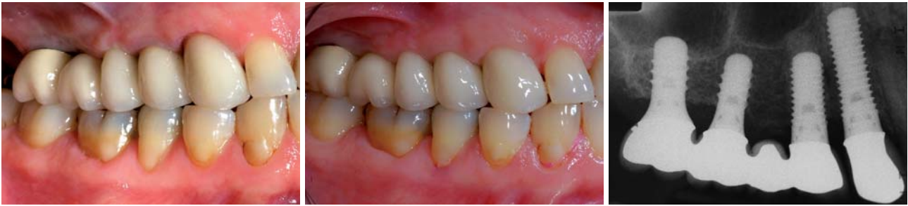
Abb. 16: VMK-Kronen nach dem Zementieren. – Abb. 17: Zustand zwei Jahre nach Eingliederung. – Abb. 18: Stabile knöcherne Verhältnisse ohne Einbrüche.

grenze zu gestalten: Die Schmelz-Zement-Grenze des natürlichen Zahnes ist nicht rund und eben wie der Rand einer Implantatplattform, sondern hat eine dreidimensionale „scaloped“ Form, liegt vestibulär und palatinal tiefer als approximal.