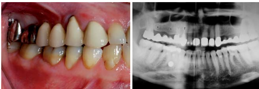
Abb. 4: Zustand vor Extraktion. Starke Rezession an 14. Geringer Anteil an keratinisierter Gingiva.– Abb.5: Planungs-OPG.

anderen Lösungen zu suchen: Gibt es Möglichkeiten Knochentransplantate zu decken, ohne die umliegenden Weichgewebe zu verschieben und mehrfach zu operieren?