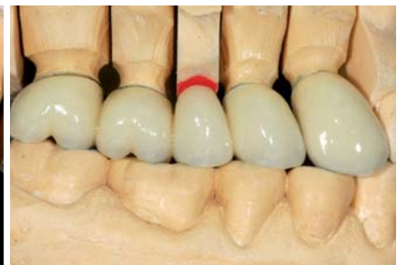
Abb. 13: Präparation der Implantate. Gingiva mit Retraktionsfäden geschützt. – Abb. 14: Meistermodell mit Gipsstümpfen wie in der konventionellen Prothetik üblich. – Abb. 15: VMK-Versorgung am Modell.