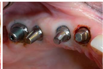
Abb. 10: Vestibulär gleichmäßige Kieferkammkontur. – Abb. 11: Narbenfreie keratinisierte Gingiva. – Abb. 12: Gingivektomie und girlandenförmige Präparation.