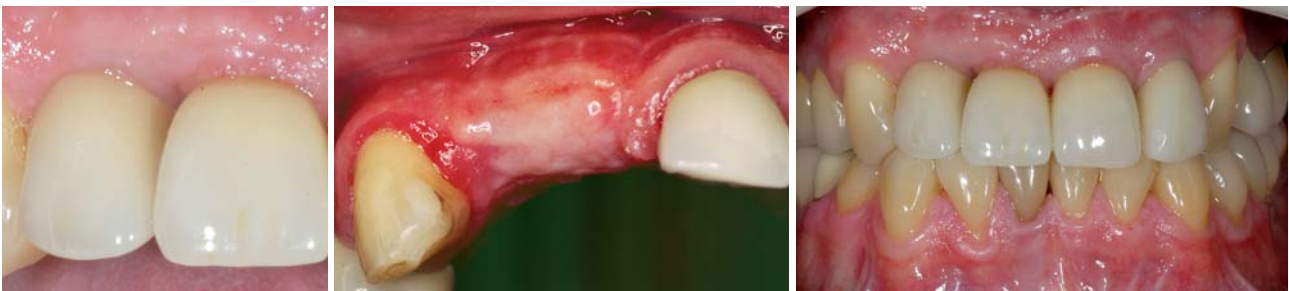
Abb. 1: Auf den ersten Blick akzeptable Papille zwischen Implantaten.– Abb. 2: Unschöner Zustand der Gingiva nach GBR und GTR.– Abb. 3: Ästhetisch schlechtes Endergebnis nach Versorgung entsprechend der gängigen chirurgisch-implantologischen Protokolle.

Ergebnisse wie jenes aus Abbildung 1 und 3 waren für uns nicht befriedigend. Sie brachten uns dazu, nach