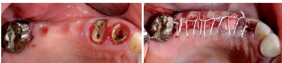
Abb. 6: Schmäler Kieferkamm.– Abb. 7: Zustand nach Extraktion, Bone Splitting, Sofortimplantation: freiliegende Kollagenmembran.