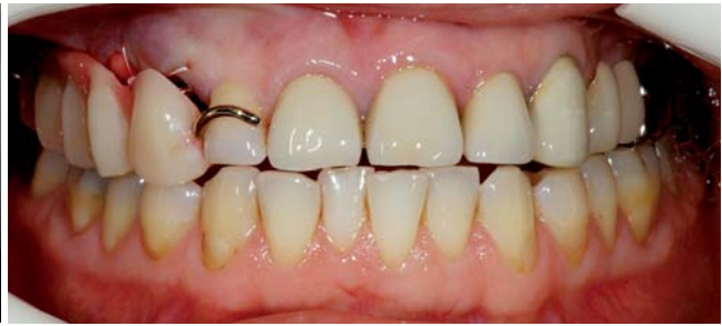
Abb. 8: Kontrollaufnahme. – Abb. 9: Provisorische Versorgung.

von 13 auf Höhe der distalen Schmelz-Zement-Grenze des Zahnes 12, um die Etablierung einer gesunden biologischen Breite zu ermöglichen.