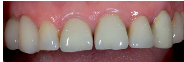
Abb. 19: Frontalansicht sofort nach Eingliederung der Kronen: Symmetrie erreicht.

Die Antwort auf die Frage, ob komplexe, teure und aufwendige chirurgische und prothetische Protokolle, wie sie in den Standardwerken der Implantologie beschrieben werden (ITI Protokoll), (Nevins 1999, Sclar 2004, Belser 2006, Hahn 2006), überhaupt noch notwendig sind, beantworten wir in unserer Praxis seit mehreren Jahren eindeutig mit „Nein“: Unser eigenes „Biologische Breite Protokoll“ führt schnell, einfach, sicher und vorhersehbar zum gewünschten Ergebnis, dem möglichst zahnähnlich aussehenden implantatgetragenen Zahnersatz.