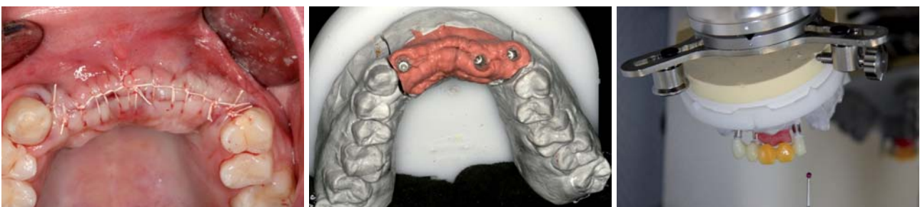
Abb. 8: Wundverschluss. – Abb. 9: Arbeitsmodell. – Abb. 10: CAD/CAM-Scanner.