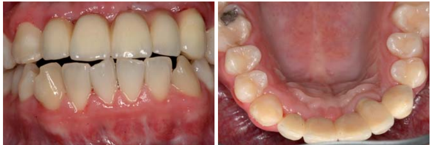
Abb. 17 und 18: Zahnersatz zwei Jahre nach Eingliederung.

Bei diesem Patientenfall wurde der Weg der prothetischen Kompensation gewählt. Sechs Monate nach der Implantation wurden die inserierten Implantate wiedereröffnet und eine Woche später mithilfe eines okklusal offenen Funktionslöffels abgeformt. Um die Defizite an Knochen und Gewebe zu kompensieren und eine optimale Ästhetik zu erzielen, wurde eine komplett keramische Versorgung der Implantate gewählt. Nach Anfertigung des Arbeitsmodells wurde das Modell mittels eines CAD/CAM-Scanners eingescannt. Die aufgrund der Übermittlung der Daten angefertigten Abutments und das Gerüst aus Zirkonoxid (nach vorherigem Wax-up) wurden in dem praxiseigenen Meisterlabor verblendet. Die Rot-Weiß-Ästhetik wurde mithilfe von rosafarbener Keramik wiederhergestellt. Eine Überstellung der progenen Bisslage konnte ebenfalls erzielt werden.