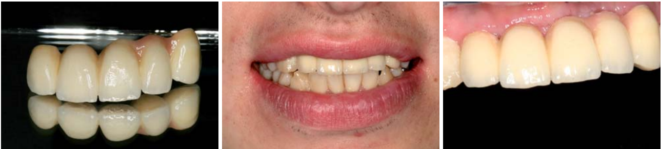
Abb. 14: Fertige Keramikbrücke. – Abb. 15 und 16: Fertige Versorgung in situ.

sorbierbaren Membran und Titan-schrauben fixiert und diese wiederum zur Verbesserung der Biokompatibilität mit einer resorbierbaren Kollagenmembran bedeckt. Der Mukoperiostlappen wurde mobilisiert und sorgfältig doppelt vernäht. Bei der postoperativen Kontrolle (drei Tage später) zeigte sich das Operationsgebiet reizlos und unauffällig.