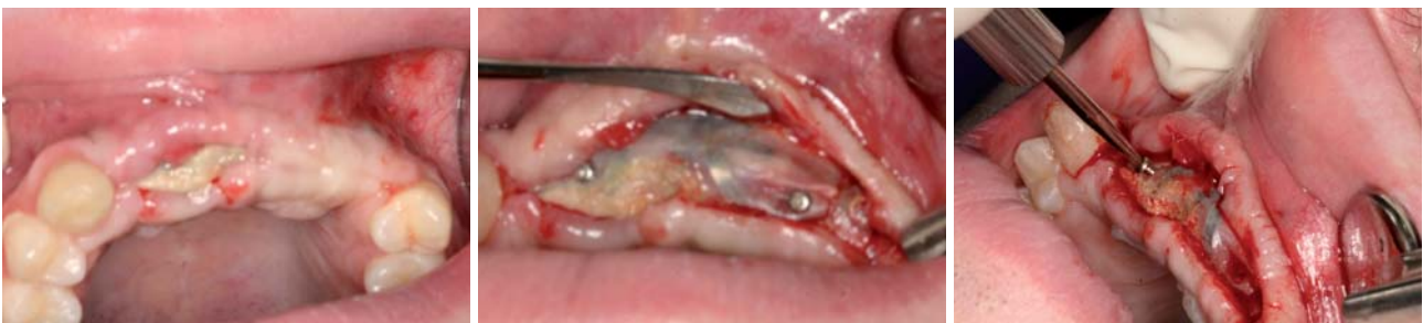
Abb. 5: Membranexposition drei Wochen postoperativ. – Abb. 6: Freilegung der Membran. – Abb. 7: Entfernung der Membran.

Intraoperativ zeigte sich ein schmaler, scharfer Kieferkamm mit nicht ausreichender Knochenbreite. Es wurden in den anatomisch günstigsten Positionen drei Implantate inseriert (OsseoSpeed 4,05 x 15, Astra Tech). Das Mikrogewinde im oberen Implantatdrittel begünstigte die Primärstabilität der inserierten Implantate. Da diese (wie präoperativ erwartet) eine vestibulärwandige Fenestrierung aufwiesen, wurde der Kieferkamm überwiegend in horizontaler Richtung mit dem bereits erwähnten Gemisch aus Eigenknochen (aus dem retromolaren Bereich im Unterkiefer), Knochenersatzmaterial und PRGF aufgebaut, mit einer titanverstärkten nicht re-