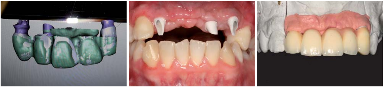
Abb. 11: Computerdatensatz. – Abb. 12: Abutments in situ (mit deutlich erkennbarer Progenie). – Abb. 13: Fertige Versorgung auf dem Modell.