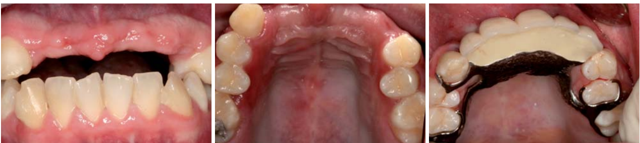
Abb. 1 und 2: Ausgangssituation. – Abb. 3: Zahnersatz vor der Behandlung.