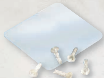
Membrane und Pins aus PDLLA

Die innovative Schalentech, basierend auf formstabilen, resorbierbaren Materialien mit Ultraschallapplikation, lässt in vielen Fällen eine Knochenblockfixation für augmentative Zwecke als nicht mehr notwendig erscheinen. Das Verwenden resorbierbarer Pins und Membranen aus 50:50 Poly-D-L-Laktid (PDLLA) erspart dem Patienten einen OP-Zweiteingriff, welcher ansonsten eine zusätzliche physische und psychische Belastung bedeutet. Die SonicWeld Rx® - Ultraschallaktivierung bewirkt eine Verflüssigung und dreidimensionale Infiltration des Pins in die Knochenstrukturen. Dieser Verriegelungsmechanismus zwischen Membrane