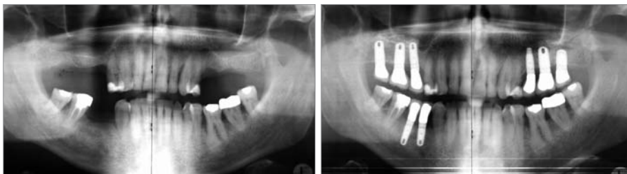
links: Zustand nach Implantation mit Sinuslift (Cerasorb M) im Oberkiefer beidseitig. Implantation im UK Regio 44 und 45. – rechts: Neun-Jahres-Kontrolle. Es ist zu erkennen, dass das Knochenregenerationsmaterial weitgehend zu eigenem Knochen umgebaut wurde.

Unterschiede. Einen wichtigen Gesichtspunkt nehmen dabei die Makroporen ein, die bei Cerasorb M eine für die Knochenregeneration ideale Konfiguration haben.