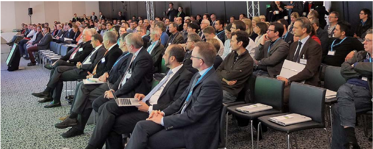
Mit 230 Besuchern verzeichnete das 8. Young ITI-Meeting einen neuen Teilnehmerrekord.