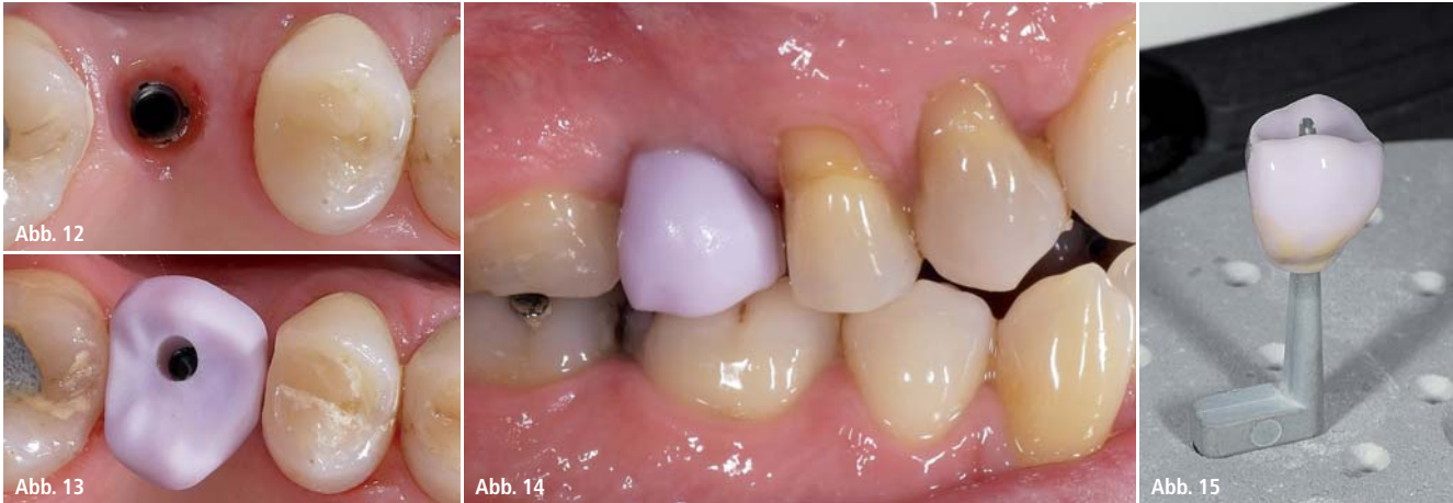
Patientenfall 2 – Abb. 12: Situation drei Monate nach Implantation. – Abb. 13: Einprobe der Hybrid-Abutmentkrone vor der Kristallisation. – Abb. 14: Einprobe der Hybrid-Abutmentkrone vor der Kristallisation. – Abb. 15: Hybrid-Abutmentkrone auf dem Brennträger vor der Kristallisation.

Der dritte Patientenfall zeigt die Versorgung in Regio 15 (Abb. 16–18).