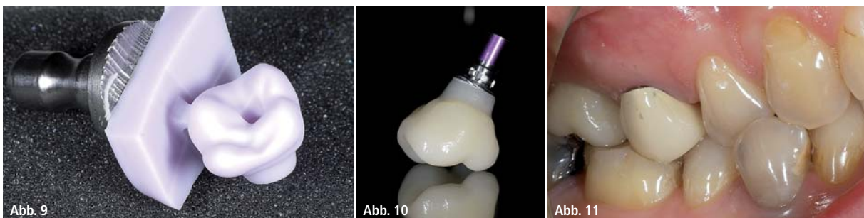
Abb. 9: Hybrid-Abutmentkrone aus der Schleifeinheit. – Abb. 10: Verklebte Hybrid-Abutmentkrone. – Abb. 11: Ansicht von intraoral nach Eingliederung.

Patientenfall 2 demonstriert die prothetische Versorgung eines Implantates in Regio 26 (Abb. 12). Die Abbildungen 12 und 13 zeigen die Einprobe der Hybrid-Abutmentkrone vor der Kristallisation. Nach der Anprobe wird die geschliffene Keramikstruktur glasiert, bemalt und mit Brennhilfpaste (IPS Object Fix Putty, Ivoclar Vivadent) befüllt (Abb. 15).