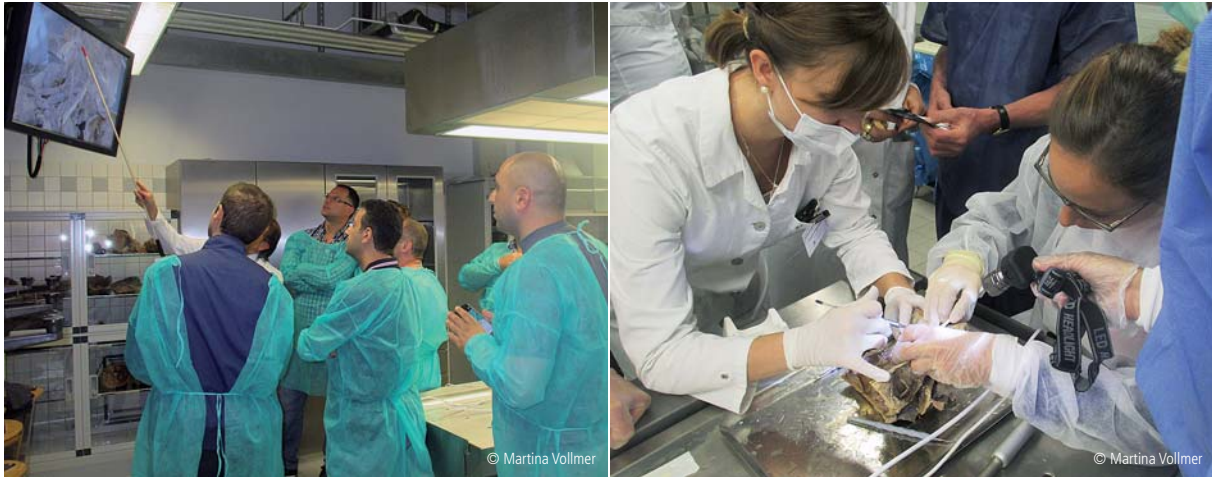
Pflichtmodul 3 sieht einen Anatomiekurs mit praktischen Übungen am Humanpräparat vor.

implantierenden Kollegen, um entsprechende neue Techniken zu trainieren.