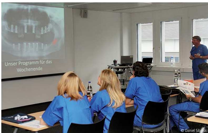
Das neue Curriculum Implantologie der DGZI kombiniert Präsenzveranstaltungen mit E-Learning.