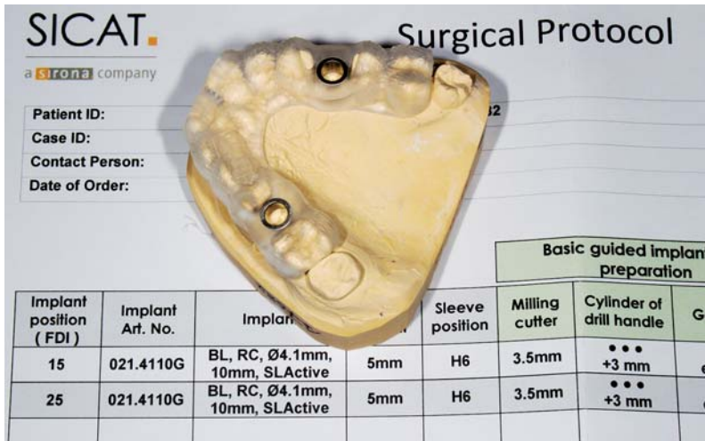
Abb. 5: Das chirurgische Protokoll mit Angaben über Bohrer und Bohrlöffel wird mit der Bohrschablone mitgeliefert.

teren manuellen Aufbereitung. 59 Dieses Problem kann mit der Anwendung von vollgeführten Systemen entgegengewirkt werden. Weiterhin besteht kein signifikanter Unterschied zwischen den 3-D-Bohrschablonen stabilisiert bei Freundsituationen oder Schatlücken. Dies zeigte sich in den Studien von Behneke et al., van Assche et al. und Neugebauer et al. 54,56,61