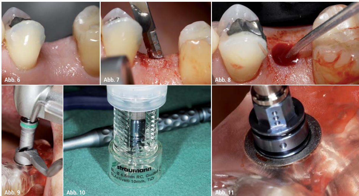
Abb. 6: Örtliche Betäubung. – Abb. 7 und 8: Präparation eines vestibulär gestielten Lappens. Kontrolle des Lagers zwischen jeder Sequenz mit einer Sonde. – Abb. 9: Durchführung der Implantatbetaufbereitung nach dem mitgelieferten chirurgischen Protokoll. – Abb. 10 und 11: Insertion des geplanten Implantats.

Das Besondere an dem System ist die Möglichkeit, auf verschiedene anatomische Gegebenheiten einzugehen. Anders als bei anderen vollgeführten Systemen (z.B. CAMLOG Guide) kann die Position der Führungshülse auf eine von drei unterschiedlichen Höhen