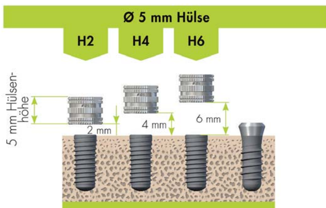
Abb. 4: Mögliche Einstellungen der Führungshülsen.

Die Winkelabweichung ist mit 6,17 \pm 3,38 Grad im Oberkiefer und mit 7,99 \pm 5,42 Grad im Unterkiefer für den Oberkiefer als günstiger zu bewerten. Bezüglich der Winkelabweichung lassen sich signifikant geringere Abweichungen ( p \leq 0,05 ) mit dem Gebrauch des Guide Systems ( 3,48 \pm 1,15 Grad) zum rein pilotgeführten System ( 7,67 \pm 4,81 Grad) erreichen. Kalt & Gehrke (2008) beobachteten Winkelabweichungen \geq 10 Grad an Implantaten, die in einen in der Breite im Bereich der Implantatschulter reduzierten Knochen inseriert wurden, und begründeten dies in der fehlenden Führung auf den ersten Millimetern bei der wei-