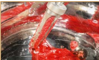
Mehrfachbohrer mit Sammelkammer für autologes Knochenmaterial