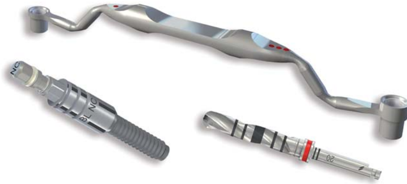
Abb. 3: Farbcodiertes System mit Implantatbohrer.

7 mm), dem Vorhandensein von Unterschnitten ( \leq 15 Grad) und vestibulären Konkavität beschränkt, ist durch den Einsatz von 3-D-Bohrschablonen die Indikation stark erweitert worden. 45-48 Mehrere Studien zeigen, dass eine erfolgreiche Osseointegration mit dem Einsatz der computergestützten Implantation in Kombination mit der Flapless Surgery erreicht werden kann und dass diese für den Behandler mit einer Steigerung der Sicherheit bezüglich des chirurgischen Eingriffes einhergeht. 37,39,49,50