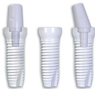
Z-Systems Z5c (zweiteilig)

Die Frage sollte aber nicht sein, ob Implantate aus Zirkoniumdioxid derzeit gleich auf sind mit Implantaten aus Titan. Vielmehr sollte die Frage gestellt werden, welches Potenzial dieses moderne Material noch in sich birgt.