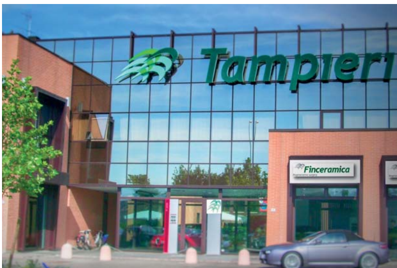
Abb. 7: Hauptsitz von Finceramica in Faenza, Italien.