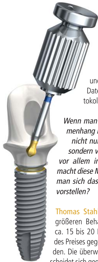
Abb. 5: Das Abutment mit dem angulierten Schraubenkanal (ASC, 0 bis 25 Grad) aus Zirkon ist für alle Nobel Biocare Implantate mit konischer Innenverbindung (CC, conical connection) erhältlich: NobelParallel CC (im Bild), NobelActive, NobelReplace CC.

und diese bewirbt, hat diese validierten Daten für die eigenen Produkte und Protokolle. Das finde ich schon fragwürdig.