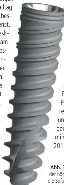
Abb. 3: NobelActive ist das Implantat mit der höchsten, bewährten Primärstabilität für die Sofortimplantation (FDA-approved).

Weiters veranstalten wir Business Club Meetings und auch Workshops zum Thema Patientenkommunikation oder Personalentwicklung. Das Interesse seitens unserer Kunden und dem zugehörigen Assistenzpersonal ist beachtlich. Die Termine sind bis in den Sommer 2016 schon wieder ausgebucht.