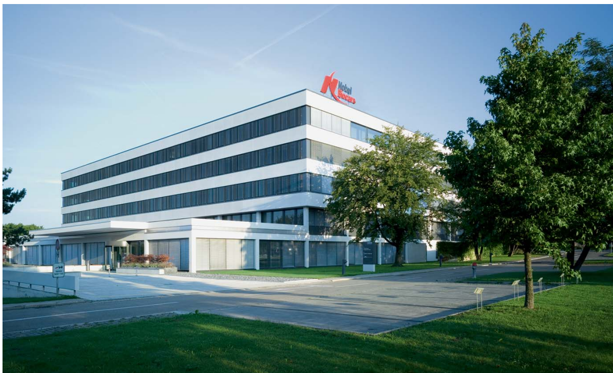
Abb. 4: Hauptsitz des Unternehmens Nobel Biocare in Kloten (Kanton Zürich), Schweiz.