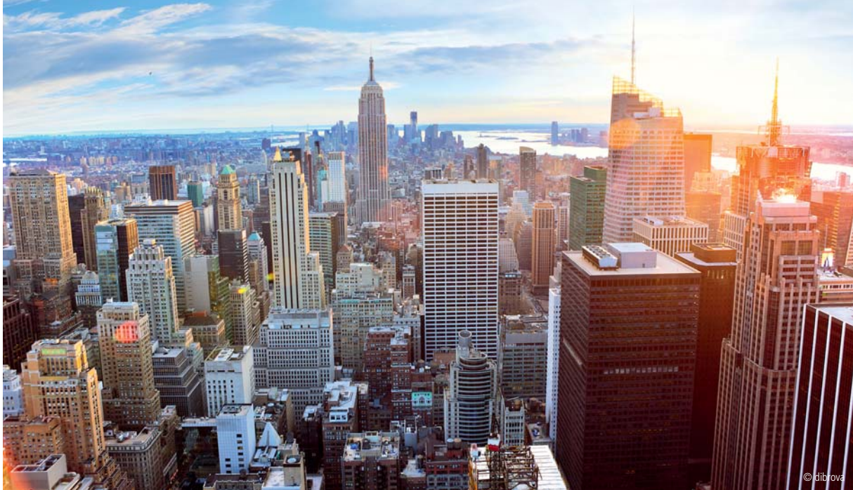
Abb. 7: Nobel Biocare Symposium 2016 mit 2.500 Teilnehmern aus aller Welt vom 23. bis 26. Juni 2016 im Waldorf Astoria, New York City. Das deutschsprachige Auftaktsymposium für Kunden aus DACH am 22. Juni wird 250 Teilnehmern empfangen.

immer sehr groß gewesen. Wir haben uns daher erstmals entschieden, ein deutschsprachiges Auftaktsymposium am 22. Juni 2016 durchzuführen, also einen Tag vor dem Start des Global Symposium in New York. Insgesamt können wir 250 Kunden für das Auftaktsymposium „aufnehmen“. Gegenwärtig (Anm. d. Red.: Mitte Dezember) hatten wir bereits schon 100 registrierte Kunden, die sich nicht nur für das Auftaktsymposium, sondern auch für die zahlreich stattfindenden Workshops und master classes angemeldet haben. Wir gehen hier nach dem Prinzip first come – first serve vor.