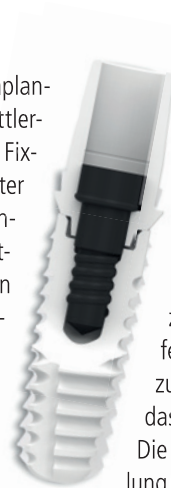
ZERAMEX® XT Implantat

Dennoch können keramische Implantate aus Zirkoniumdioxid mittlerweile eine echte Alternative zu Fixturen aus Titan darstellen. Unter Beachtung bestimmter Anwendungsmodalitäten, wie der Notwendigkeit der Ruhigstellung in der Einheilphase, kann erfolgreich mit diesen Systemen gearbeitet werden. Erste 5-Jahres-Erfolgsraten von 94,95 % unterstützen diese These und machen sie vergleichbar mit Implantaten aus Titan und empfehlen Keramikimplantate speziell bei Patienten mit einer Titanunverträglichkeit und bei Patienten, die den Wunsch nach metallfreien Restaurationen äußern. Allerdings sind noch weitere Studien erforderlich, um die Eignung von ZrO_2 als Ausgangsmaterial für dentale Implantate auszubauen. Der Schwachpunkt der einteiligen Systeme ist nach Lage der Literatur weniger in der Stabilität der Implantate als vielmehr in der Überbrückung der Einheilphase zu