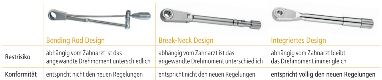
Tab. 1: Übersicht unterschiedlicher Drehmomentschlüsseldesigns in Abhängigkeit der Drehmomentkontrolle und Konformität mit EU-Direktiven 93/42/CEE und 98/79/CE.

Erfindungen zu schützen. Da wir von Anfang an immer höchste Qualität und Zuverlässigkeit garantieren, legen wir sehr viel Wert auf die Sicherheit unserer Produkte. Das führt dazu, dass wir heute im Bereich Drehmomentbegrenzer das einzige Instrument vermarkten, welches die neuen Anforderungen der Risikominimierung erfüllt.