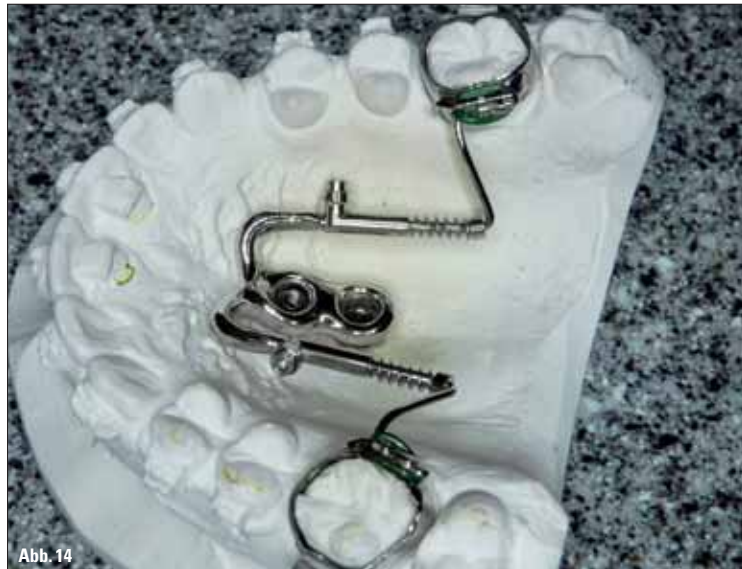
Abb. 13: Seitenansicht konventioneller Distal-Jet auf dem Modell. – Abb. 14: Seitenansicht gegossener Distal-Jet (Miniimplantat-gestützt) auf dem Modell.

die Idee auf, die Modellgusstechnik dafür zu nutzen. Also wurde schließlich das Verbindungsteil (Suprakonstruktion) individuell modelliert und gegossen (Abb. 7, 8). Die konfektionierten Distal-Jet-Teleskope wurden anschließend angelasert. Es entstand eine stabile und passgenaue maximale Verankerungseinheit, der gegossene Distal-Jet (Abb. 9, 14). Das Gerät lässt sich im Patientemund bequem einsetzen und mit den Innenschraubchen an den Miniimplantaten fixieren (Abb. 10). Die Aktivierung der 240-g-Feder geht genauso schnell und einfach wie beim herkömmlichen Distal-Jet.