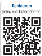
Dentaurum [Infos zum Unternehmen]

Die Geschäftsleitung bedankt sich bei allen Jubilaren für die langjährige, vertrauensvolle Zusammenarbeit. Privat wie beruflich wünscht sie ihren Mitarbeitern das Beste für die Zukunft. KN