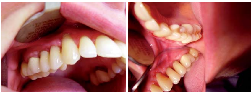
Abb. 5 und 6: Klinische Situation vier Wochen postoperativ.

2007 untersuchten Gutknecht, Mir und Moghare Abed die Oberflächenbeschaffenheit von Wurzeln nach laserunterstütztem Scaling und Root Planing während der offenen Kürettage und empfehlen für diese Indikation den Einsatz des Er:YAG-Lasers bei kleineren