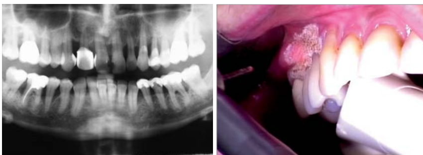
Abb. 1: Präoperatives OPT. – Abb. 2: Deepithelialisierung.

prägte hämostatische Wirkung aus, die eigentliche Konkremententfernung stellt sich jedoch als sehr schwierig dar und macht eine mechanische subgingivale Instrumentierung unumgänglich. Zudem ist bei Anwendung dieser Lasersysteme eine irreversible thermische Schädigung der Pulpa und der Wurzeloberfläche nicht auszuschließen. 4,5,6 Diese Tatsache ließ in den vergangenen Jahren den Er:YAG-La-