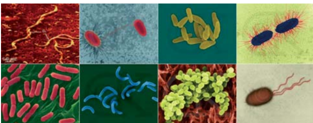
Abb. 1: Winzig klein, aber von großer Bedeutung für die orale Gesundheit.

Schütze-Gössner et al. sehen die Behandlung der Periimplantitis aufgrund der multifaktoriellen Genese und der komplexen Struktur-, Gewebs- und Stoffwechselsituation hinsichtlich des Ergebnisses als schwierig und nicht immer zufriedenstellend an. Die Autoren weisen darauf hin, dass viele der aktuellen Implantatsysteme eine mikrostrukturierte Oberfläche aufweisen, welche zwar große Vorteile bei der Osseointegration birgt, im Falle einer sich etablierenden Periimplantitis jedoch aufgrund der möglichen raschen Plaquebildung auf der rauen Oberfläche unter diesem Aspekt erhebliche Nachteile mit sich bringt. Alle Autoren, die zum Thema Periimplantitis berichten, fordern vor der Einleitung regenerativer Schritte eine Dekontamination der freiliegenden Implantatoberflächen.