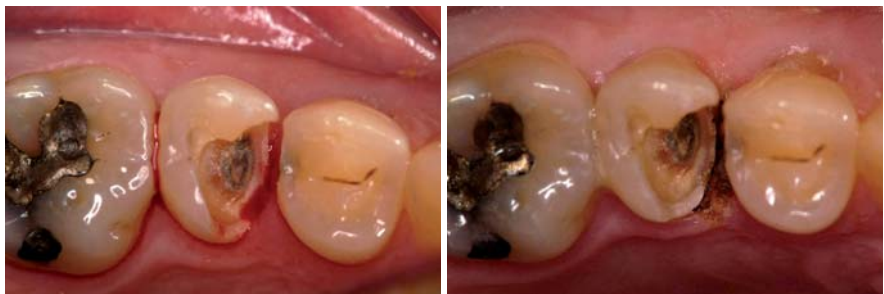
Abb. 1: Starke Sulkusblutung nach Entfernen der alten Füllung. – Abb. 2: Klare, trockene Darstellung des Operationsgebietes nach Lasereinsatz.

Für mich zeichnet sich ein idealer Diodenlaser des Weiteren durch eine besonders kompakte Bauweise und ein geringes Gewicht aus, wodurch er leicht von einem zum anderen Sprechzimmer transportiert und betriebsbereit gemacht werden kann. Ideal für einen schnellen und sicheren Einsatz ist es, wenn die Leistungsparameter des Lasers über Festprogramme für die wichtigsten Indikationen Chirurgie, Parodontologie und Endodontie voreingestellt werden können. Spezifische Einstellungen der Emissionsmodi (Schwingungsstärke und -typ) sollte der Anwender ergänzend über selbst programmierte Behandlungsparameter vornehmen können. Über diese Produkteigenschaften verfügt der kompakte und leistungsstarke SIROLaser Advance von Sirona, den ich seit seiner Markteinführung im April dieses Jahres erfolgreich in