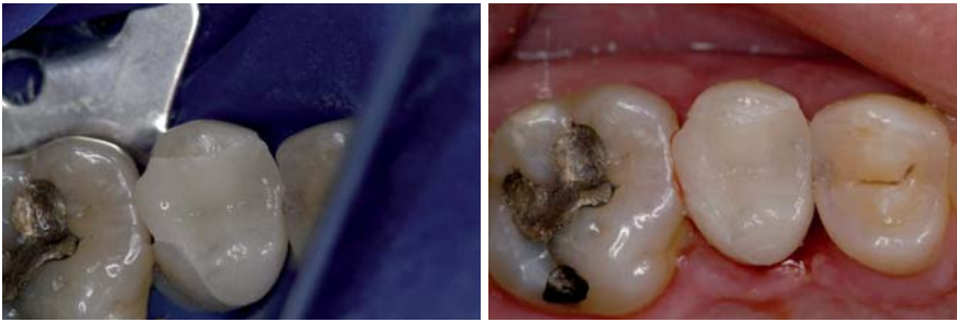
Abb. 4: Einprobe vor adäsvem Befestigen unter Trockenlegung mittels Kofferdam. – Abb. 5: Ergebnis nach dem Einsetzen.

lung, zur Hämostase bei der optischen Abdrucknahme und bei der adhäsiven Befestigung.