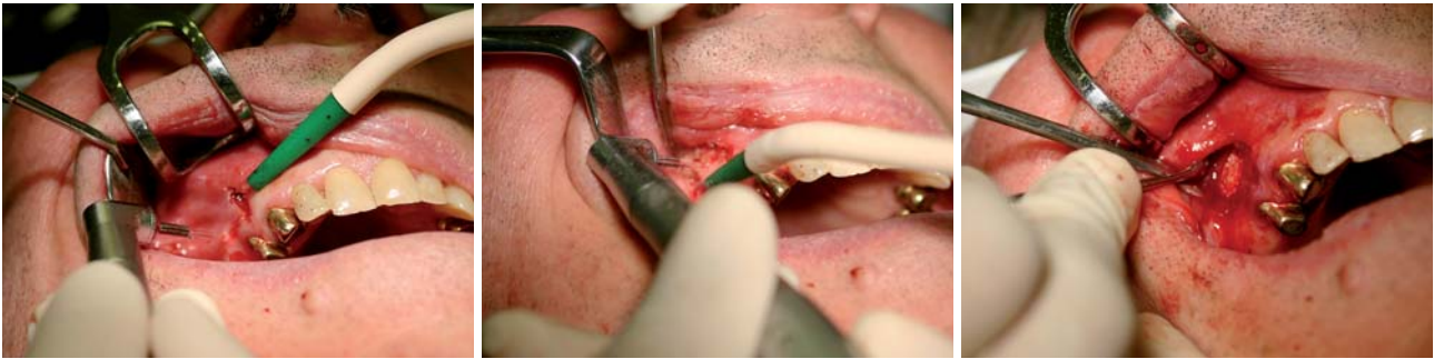
Abb. 9: Schnittführung mit dem Chirurgiemeißel. – Abb. 10: Freilegen der Wurzelspitze. – Abb. 11: Einbringen von easy graft nach der Resektion.

NaOCl, EDTA- oder CHX-Lösung gespült. Wichtig ist, dass die Flüssigkeit im Kanal verbleibt, um sie mit dem Laser zu entfernen. Es handelt sich um eine Trocknung, Rückstände in den Kanälen sind nicht zu erwarten. Der Nachweis dieser Hypothese kann in der Praxis nicht erfolgen, wird aber durch die positiven Ergebnisse im Sinne des Patienten durch den langjährigen, entzündungsfreien Verbleib der Zähne unterstützt. Diese Aussagen werden, was die Er:YAG- und Er,Cr:YSGG-Laser betrifft, bestätigt (George et al. 2008).