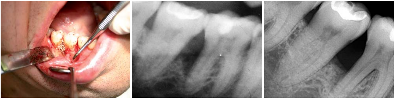
Abb. 6: Vorbereitung einer Knochenkavität mit dem KEY3+ (Einstellung: 350 mJ, 6 Hz), anschließende Defektfüllung mit easygraft (DS Dental). – Abb. 7: Ausgangssituation vom 08.04.2008. – Abb. 8: Situation am 29.09.2008.