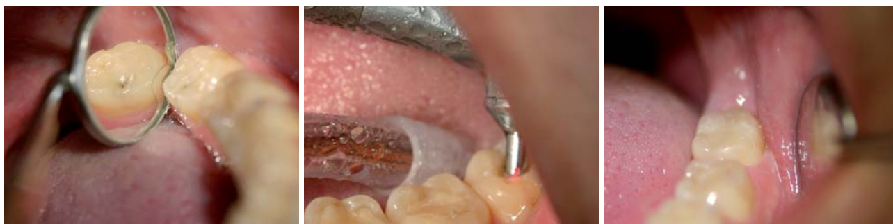
Abb. 3: Ausgangssituation Zahn 38 DD 70 Peak (DD – DIAGNOdent). – Abb. 4: Einsatz des Kontakthandstücks 2063 im Feedbackmodus. – Abb. 5: Versorgung von Zahn 38 mit Point 4 Composit.

In der Endodontie erzielt der KEY 3-Laser in der Dekontamination und Trocknung der Kanäle – aus der eigenen Praxiserfahrung heraus – in Kombination mit dem HealOzone-Gerät die besten Ergebnisse. Dazu wird der Kanal mechanisch aufbereitet und mit