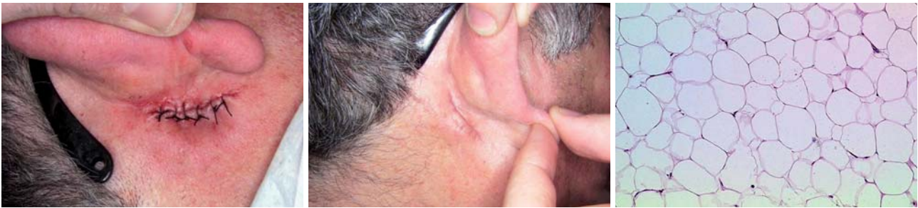
Abb. 5: Wundverschluss. – Abb. 6: Problemlos verheilte Wunde. – Abb. 7: Histologischer Schnitt.

die vor Lipomen schützen oder ihr Wachstum beeinflussen, sind bislang nicht bekannt. Folgende Symptome rechtfertigen die chirurgische Entfernung: