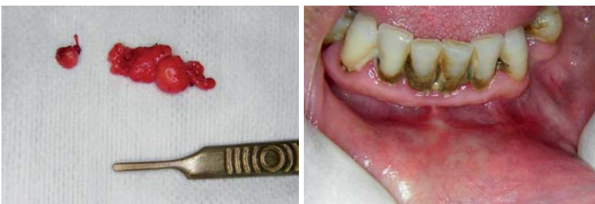
Abb. 10: Exzidiertes Lipom. – Abb. 11: Zustand bei Kontrolle.