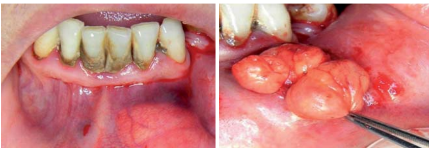
Abb. 8: Orales Lipom, linke Unterlippe. – Abb. 9: Präparation und Entfernung des Lipoms.

Der Tumor wurde unter stumpfer Präparation mithilfe des emittierenden Lasers vom umliegenden Gewebe getrennt und ohne Verletzung der äußerst subtilen Nachbarstrukturen entfernt (Abb. 3 und 4). Nach Spülung der Wunde mit steriler Kochsalzlösung erfolgte der Wundverschluss mit sechs Einzelstichnähten der Stärke 4-0 (Abb. 5). Die Wundheilung verlief problemlos, im histologischen Schnitt sieht man die Lipomstruktur sehr anschaulich (Abb. 6 und 7).