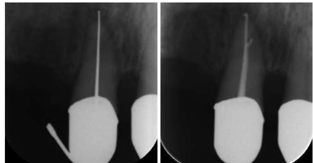
Abb. 2a: Patientin mit extremen Schmerzen an 11, Lockerungsgrad 2. – Abb. 2b: Aufnahme zur Kontrolle nach sechs Monaten, Lockerungsgrad 1 und schmerzfrei.

Für die oben angesprochenen Wirkungen steht uns der Diodenlaser ora-laser jet (ORALIA medical GmbH) zur Verfügung. Er zeichnet sich als mobiles und kompaktes Gerät aus, in welchem eine Diode eine Laserstrahlung mit einer Wellenlänge von 810 nm erzeugt. Die im Gerät integrierte