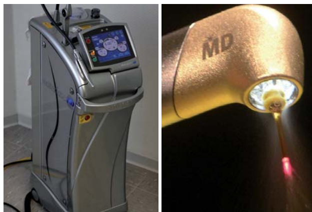
Abb. 1: Biolase Waterlase MD Turbo.–Abb. 2: Goldhandstück mit ZrO 2 Tip.

Zur Kavitätenpräparation und Kariesexkavation kam ein Er,Cr:YSGG-Laser (2.780 nm), Waterlase MD Turbo, der Firma Biolase zum Einsatz (Abb. 1).