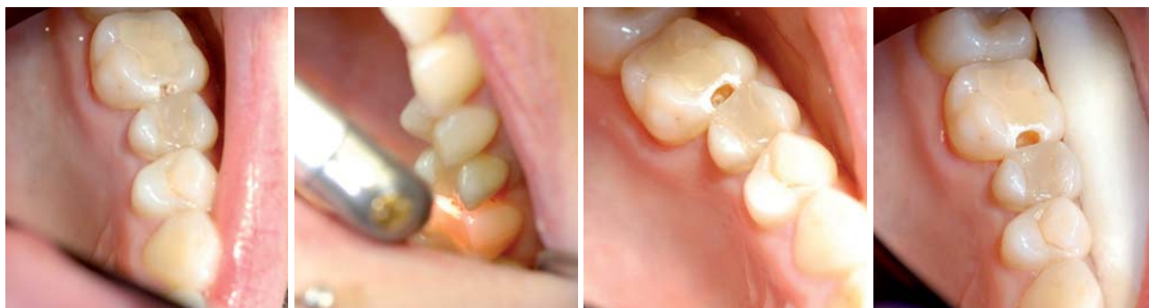
Abb. 3: Kariöser Zahn 26.–Abb. 4: Schmelzbearbeitung.–Abb. 5: Fertige Kavität mit Restkaries.–Abb. 6: Nach Kariesentfernung.

Die folgende Exkavation der Karies wurde mit 3 Watt, 30 Hz, einer Pulslänge von 140 µs sowie 35 % Wasser