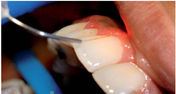
Abb. 3: Aufziehen der entstandenen laseraktivierbaren Farbstofflösung in einer Einwegspritze.– Abb. 4: Gepulste Lichtaktivierung mit dem elexxion-Laser.