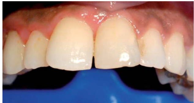
Abb. 1: Gingivarötung mit Entzündungszeichen.

Essenziell dabei ist die korrekte Verwendung der definierten Laserlichtquelle in Kombination mit dem Photosensitizer. Das heißt, dass der Farbstoff speziell auf die verwendete Wellenlänge abgestimmt sein muss, ansonsten findet keine Absorption des Laserlichts im Wirkstoff statt. Die dabei verwendeten Energieeinstellungen bewegen sich im Milliwattbereich (meist 100 mW), sodass eine schmerzfreie Behandlung für den Patienten möglich ist.