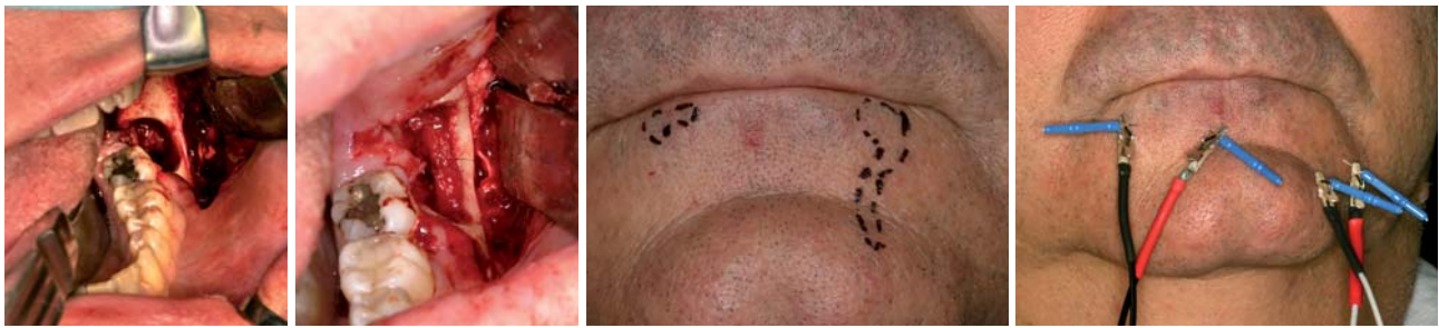
Abb. 9: Nervus alveolaris inferior vor chirurgischer Rekonstruktion. – Abb. 10: Nervus alveolaris inferior nach chirurgischer Rekonstruktion. – Abb. 11: Ausbreitungsgebiet der Sensibilitätsstörung. – Abb. 12: Elektrostimierte Akupunktur.

differenzialdiagnostisch eine Herpes Zoster-Infektion in Betracht gezogen werden. Hierbei handelt es sich um eine Zweitmanifestation einer Varizella-Zoster-Viren-Infektion. Diese Viren persistieren nach einer Erstinfektion (Windpocken) lebenslang in den Gliazellen der Spinalganglien. Durch Immundefizienz (z.B. auch nach OP) können die neurotrophen Viren endogen reaktiviert werden. Die Inzidenzrate dieser Virusinfektion beträgt 400/100.000 Einwohner, die Prävalenzrate liegt bei 80/100.000 Einwohner.