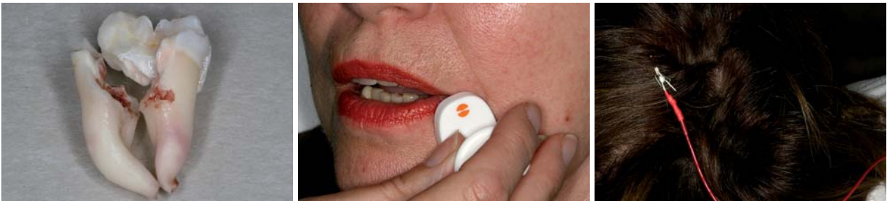
Abb. 6: Osteotomierter Zahn 48 bei interrädikulärem Nervverlauf. – Abb. 7: Ableitung SSEP 1. Elektrode. – Abb. 8: Ableitung SSEP 2. Elektrode.