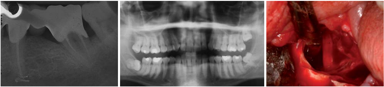
Abb. 3: Überstopftes Wurzelkanalfüllmaterial im Nervkanal. – Abb. 4: OPG: Interradikulärer Verlauf des Nervus alveolaris inferior Zahn 48. – Abb. 5: Intraoperative Darstellung des interrädikulären Nervverlaufes.