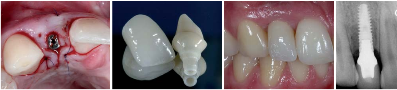
Abb. 12: Das Freilegen des Implantates erfolgt mit der „Split-finger-technique“. – Abb. 13: Der individualisierte CERCON® Aufbau und die Keramikkrone vor der Eingliederung. – Abb. 14: Die eingegliederte Krone. – Abb. 15: Perfekter Sitz von Implantat und Krone.

ersatzmaterial und eine Kollagenmembran zur Anwendung (Abb. 5–7). Das Augmentat wurde schließlich zweischichtig mit einem gestielten Bindegewebs-Transplantat aus dem palatinalen Bereich von 13 und 14 gedeckt (Abb. 8 und 9). Die Entnahmestelle kommunizierte mit dem OP-Bereich. Das gestielte Transplantat wurde in den defizitären Bereich einrotiert, wodurch der Bereich zusätzlich weichgewebig augmentiert und eine zweischichtige Deckung des Knochenaugmentates gewährleistet werden konnte. Die Implantatinsertion (XiVE® 3,8x13) fand vier Monate nach der Augmentation statt (Abb. 10). Nach drei Monaten gedeckter Einheilung (Abb. 11) erfolgte die mikrochirurgische Freilegung mittels „Split-finger-technique“ (Abb. 12). Im entsprechenden Laborprozess wurde der CERCON® Aufbau individualisiert, die Vollkeramikkrone hergestellt (Abb. 13)