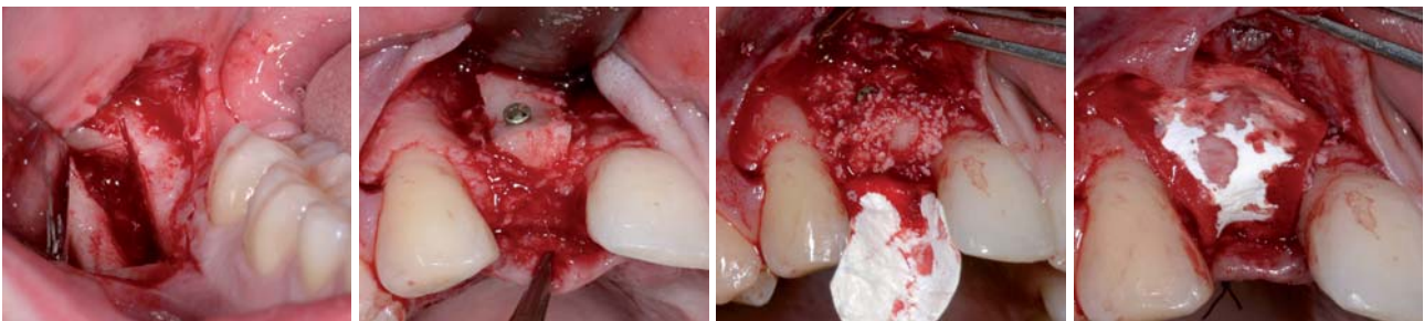
Abb. 4: Entnahme eines Knochenblocks aus der retromolaren Region. – Abb. 5: Mithilfe des Knochenblocks und Knochenersatzmaterial wird die Kontur des Kieferkamms wiederhergestellt. – Abb. 6 und 7: Die Kollagenmembran deckt den augmentierten Bereich ab.