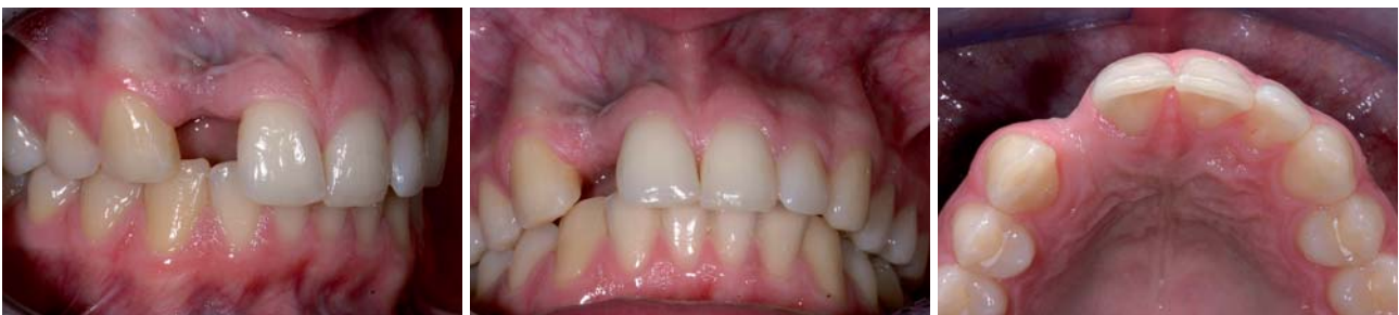
Abb. 1–3: Der Verlust des Zahnes 12 führte zum horizontalen und vertikalen Knochenabbau. Die Narbenbildung infolge einer Wurzelspitzenresektion erschwerte die Situation zusätzlich.

Oft sind es die kleinen, unscheinbaren und eventuell als unwichtig eingestuften Details, die ein System ausmachen. Die Bedeutung derartiger Aspekte wird zum Teil erst im Laufe der Anwendung bemerkt. Dies soll am Beispiel der knochenspezifischen Aufbereitung für eine atraumatische Platzierung im harten sowie augmentierten Knochen illustriert werden. Eine wichtige Rolle spielt dabei die Gestaltung der Vorbohrer. Die XiVE® Spiralbohrer haben im Bereich der Boh-