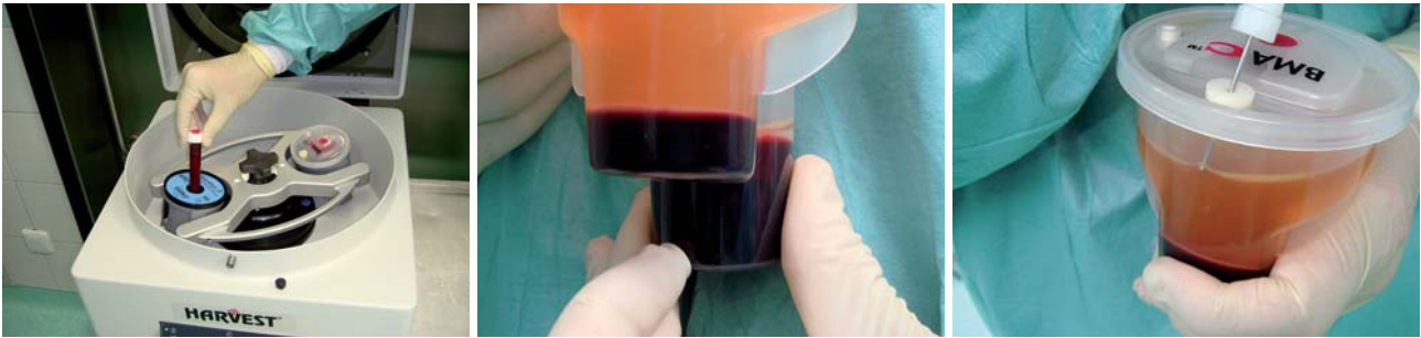
Abb. 7: Vorbereitung zur Zentrifugation mit autologem Trombin. – Abb. 8: Nach 14-minütiger Zentrifugation ist eine weiße Bande mit mononukleären Zellen zu erkennen. – Abb. 9: Abnahme des Plasmaüberstandes.

ist ein schnelles und benutzerfreundliches Vorortsystem mit dem Ziel, die chirurgischen Ergebnisse durch die Beschleunigung des natürlichen Heilungsprozesses wesentlich zu verbessern und die Entnahmemorbidität für den Patienten zu minimieren. Die in den letzten vier Jahren gewonnenen Daten für die Sinusbodenelevation bei über 100 Patienten sind vielversprechend. Auch die Ergebnisse bei anderen Indikationen und aus anderen Fachbereichen deuten darauf hin, dass der kombinierte Einsatz der