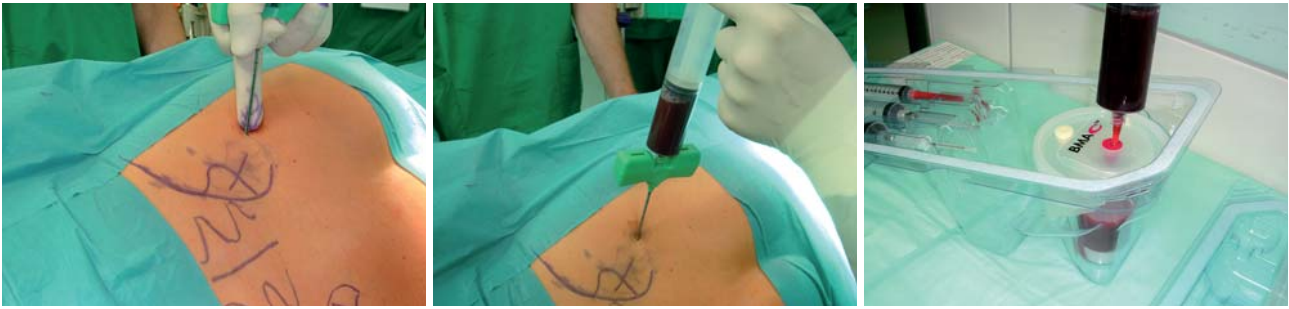
Abb. 4: Punktion des Beckenkamms. – Abb. 5: Aspiration von ca. 60 ml Knochenmark. – Abb. 6: Transfer des Aspirates in Zweikammer-Zentrifugenbecher.