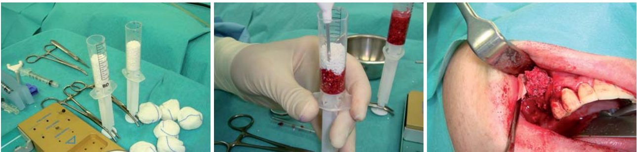
Abb. 10: Vorbereitung der Matrix aus Knochenersatzmaterial Geistlich Bio-Oss. – Abb. 11: Überführung des Konzentrates. – Abb. 12: Einbringen des Konglomerates aus Konzentrat und Geistlich Bio-Oss in den präparierten Sinus.

Knochenmarkkonzentrate und langzeitstabilen Trägermatrizes bald auch Beckentransplantate ersetzen könnte. 9,10,11,12,13 Zur Entnahme reicht eine kleine Punktion der Hüfte dorsal oder ventral, über die für craniomaxillofaciale Anwendungen etwa 60 ml Knochenmark aspiriert werden (Abb. 1). Die aus dem Knochenmark gewonnenen Zellen werden unter kontrollierten Bedingungen in einer Chairside-Sitzung zentrifugiert. Die Zellen werden dabei in ihrer natürlichen Plasmaumgebung