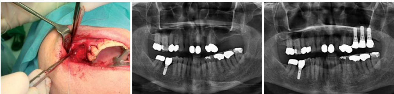
Abb. 13: Abdeckung des lateralen Zugangs mit Geistlich Bio-Gide und Nahtverschluss. – Abb. 14: Präoperatives OPG August 2008. – Abb. 15: OPG nach Augmentation und anschließender Implantatinsertion Februar 2009.