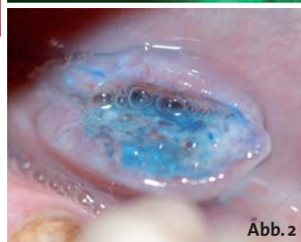
Abb. 1: Karzinom unter a) Weißlicht und b) Autofluoreszenz bei 400 nm. In diesem Fall zeigte das Karzinom eine rote Autofluoreszenz bei einer Anregung mit 400 nm. – Abb. 2: Mundbodenkarzinom (wie Abb. 1) nach Toluidinblau-Färbung.