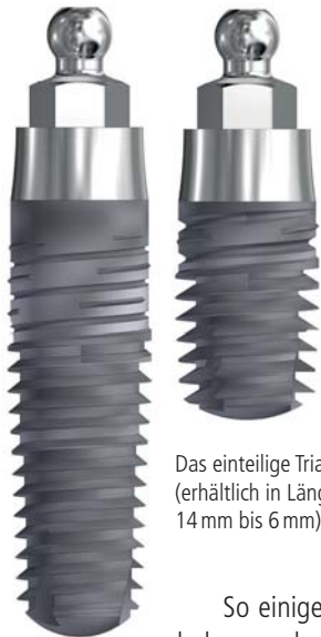
Das einteilige Trias® Mini 3,8 (erhältlich in Längen von 14 mm bis 6 mm).

So einige Praktiker haben nach wie vor – gewissermaßen aus Tradition – Vorbehalte gegenüber einteiligen Implantaten, z.B. wird die Indikationsbreite oft extrem unterschätzt. Dabei hat sich diese längst erweitert, u.a. durch die Möglichkeit, optimale Implantatbetten in kürzerer Zeit zu generieren. Kleine Defekte lassen sich heute einfach und vorhersagbar durch periimplantäre Anlagerung von Augmentationsmaterial beheben. Kritisch betrachtet wird teilweise auch die unmittelbare Belastung der Implantate nach Insertion bzw. die provisorische Phase, die Wochen 2 bis 8 nach einer Implantation. In dieser Zeit gelten alle Implantate gegenüber seitlich einwirkenden Scherkräften als sensibel. Angesichts der mittlerweile vieljährigen Praxiserfahrung ist dieser Einwand allerdings nicht mehr wirklich