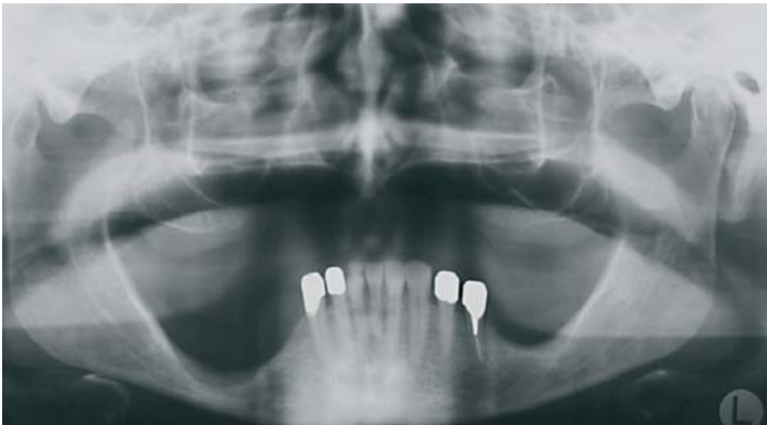
Schwierige Ausgangssituation für eine implantologische Therapie bei stark vermindertem Knochenangebot.

krankungen haben einen signifikanten Einfluss auf frühe Implantatverluste. 3,18 Ebenso müssen auch Er-