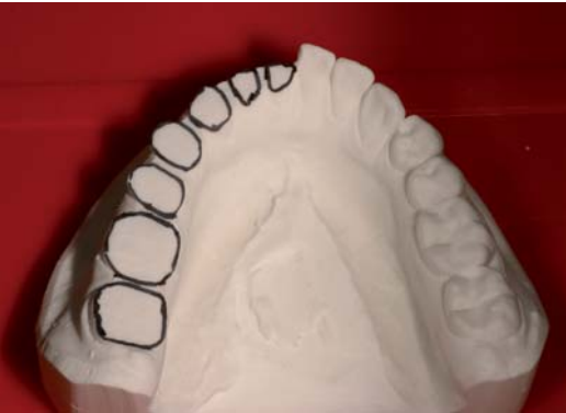
Abb. 1 und 2: Anatomisch geformte Seitenzahnabutments eines weiteren Falles auf dem Meistermodell OK.

thoden zu entwickeln, die einer großen Masse der Patienten ein einfaches Verfahren zur Verfügung stellt, das mit einer Minimalzahl an Behandlungsschritten – und damit auch mit möglichst wenig Kostenaufwand – ein Optimum an Ergebnisqualität er-