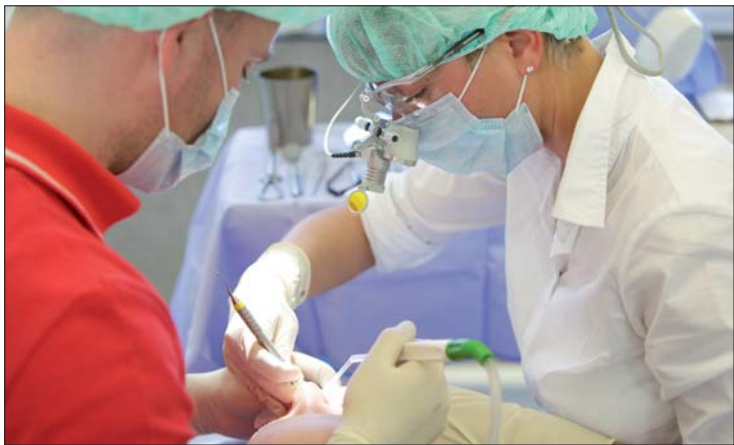
Operation eines Patienten im Studiengang MasterOnline Parodontologie & Periimplantäre Therapie.

zeiten sind frei einteilbar. Die Studierenden werden im Studium von Teletutoren begleitet, die als Spezialisten für Parodontologie auch fachlich kompetente Ansprechpartner sind. Die Präsenzveranstaltungen konzentrieren sich auf Hands-on-Kurse; besonders hervorzuheben ist hier der Kurs am Humanpräparat, bei dem die Teilnehmer sich noch einmal intensiv mit den anatomischen Strukturen des Ober- und Unterkiefers und insbesondere des Parodonts aus-