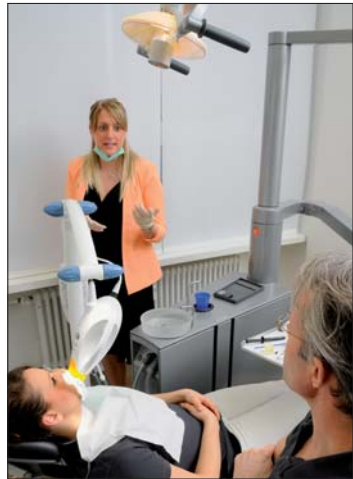
Die Philips ZOOM Praxissschulung zur Zahnaufhellung kommt kostenlos vor Ort.