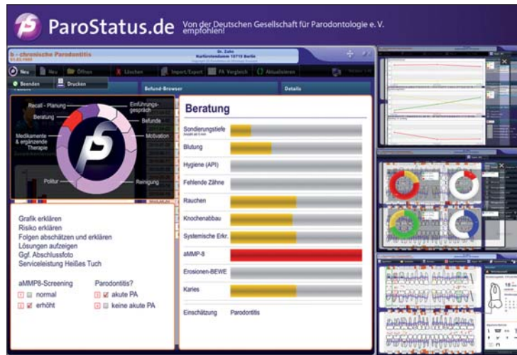
Abb. 8: ParoStatus.de-System – von der DGP empfohlen.