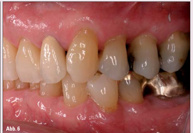
Abb. 1-3: 53-jährige weibliche Patientin mit Verdacht auf aggressive Parodontitis nach 9 Jahren im regelmäßigen Recall (4 x jährlich) und guter Compliance. – Abb. 4-6: 82-jähriger männlicher Patient mit generalisierter chronischer Parodontitis nach 27 Jahren im regelmäßigen Recall (3-4 x jährlich).

Andererseits können die Immunabwehr, eine gute Mundhygiene sowie eine engmaschige Patientenbetreuung das Krankheitsrisiko mindern. Am Ende entscheidet die Überlegenheit einer Seite, ob die Krankheit weiter fortschreitet, aufgehalten wird oder sogar die Heilung beginnt. Der Patient trägt mit seinen Verhaltensweisen (Compliance) im Wesentlichen dazu bei, in welche Richtung diese Reise geht. Wichtige Waffen in diesem Kampf sind einerseits eine stetig rekurrierende und ausführliche Aufklärung, Motivation und Instruktion des Patienten zur Steigerung der Eigenverantwortung; auf der anderen Seite aber auch eine gute Diagnostik und Patientenführung durch das zahnärztliche Team.