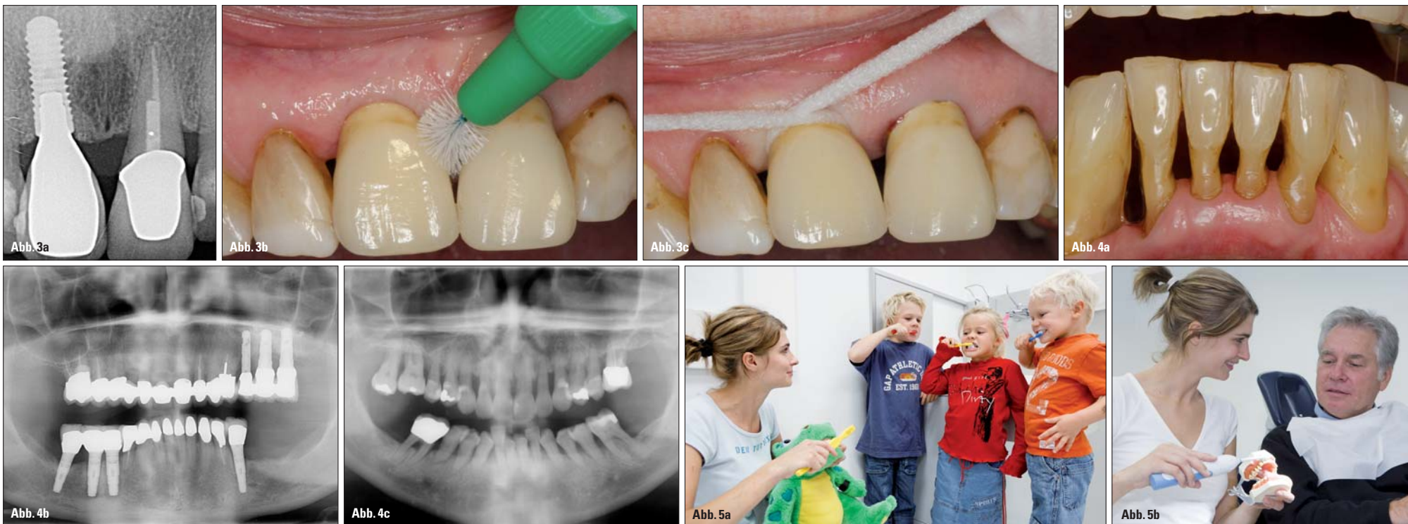
Abb. 3a–c und 4a–c: Die häusliche Prophylaxe im Bereich von Implantaten erfordert mitunter motorische Fähigkeiten, die nicht von allen Patienten erwartet werden können. Dies gilt insbesondere dann, wenn auch parodontologische „Herausforderungen“, z. B. das Reinigen von Furkationen, durchgeführt werden sollen. – Abb. 5a und b: Prophylaxe ist Teamarbeit – in allen Altersgruppen! Vereinfacht ausgedrückt gilt folgende Regel: Häusliche Prophylaxe führt nur in den seltensten Fällen zum Erfolg – professionelle Hilfe in unterschiedlicher Intensität (abhängig vom individuellen Erkrankungsrisiko) ist erforderlich.

Patienten überhaupt für das Prophylaxeprogramm des Zahnarztes zu gewinnen. Ein möglicher Einwand, dass der Patient für seine Mundgesundheit selbst verantwortlich sei, steht der Annahme einer Pflicht des Zahnarztes zur Individualprophylaxe nicht entgegen. Ein derartiger Einwand der Selbstverantwortlichkeit des Patienten aufgrund allgemein voraussetzender Kenntnis bzgl. der richtigen Maßnahmen für die Verhinderung von Karies und Parodontose greift nicht. Ein weit überwiegender Teil der Bevölkerung ist hinsichtlich der richtig durchzuführenden Mundhygiene, der zahngesunden Ernährung und der häuslichen Fluoridierung ungenügend informiert. Allgemeine Grundkenntnis, aus der sich herleiten ließe, dass es für den Zahnmediziner keinen Anlass zum