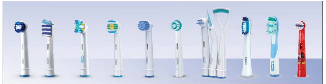
Abb. 2: Allein die Vielzahl des Angebotes an häuslichen Mundhygieneprodukten (hier nur Aufsätze für eine elektrische Zahnbürste) zeigt: Ein ideales Hilfsmittel für die häusliche Prophylaxe existiert (noch) nicht.

Zwei Beispiele sollen dies veranschaulichen: