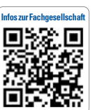
Infos zur Fachgesellschaft