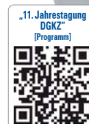
„11. Jahrestagung DGKZ“ [Programm]

Ein hochkarätiges Referententeam wird die „Rot-weiße Ästhetik“ sowohl im Hinblick auf funktionelle, chirurgisch-prothetische bis hin zu parodontologischen und kieferorthopädischen Aspekten beleuchten. Traditionell gehört der Blick über den Tellerrand in Richtung Ästhetische Chirurgie wieder