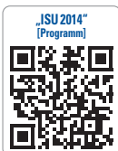
„ISU 2014“ [Programm]

Jährlich seit 1994 veranstaltet, hat sich die Kombination zu einer der traditionsreichsten deutschen Implantologie-Events entwickelt. Erklärtes Ziel und