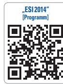
„ESJ 2014“ [Programm]

orientierten Vorträgen präsentiert das gemeinsame wissenschaftliche Programm dem Hauptthema entnommene aktuelle Fragestellungen, die von einem hochkarätigen Referententeam mit erfahrenen Praktikern und renommierten Hochschullehrern erörtert werden. Abgerundet wird das Angebot durch ein zweitägiges Programm für die Implantologische Assistenz mit einem Hygiene- und QM-Seminar, womit der Kongress zum Fortbildungs-Highlight für das gesamte Praxisteam wird. Jeder Kongressteilnehmer (Zahnarzt und Zahntechniker) erhält, in der Kongressgebühr inkludiert, das aktuelle „Jahrbuch Implantologie 2014“.