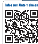
Infos zum Unternehmen

Moderator Kai Pflaume führt durch die „Night in Motion“, einen stimungsvollen Abendevent mit überraschenden Showacts, Live-musik, interessanten Gesprächen und erlesenen Speisen und Getränken.