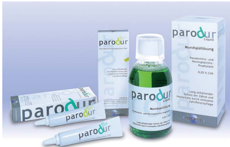
Abb. 2: Die parodur-Produktfamilie.

Wenn im schlimmsten Fall beide Partner von einer Parodontitis betroffen sind, aber nur einer davon die Prophylaxe- oder Parodontalbehandlung durchführen lässt, kann dies zu erhöhter Rezidivgefahr des behandelten Patienten führen. Bei jeder Kontrollsituation wurde die Blutungsneigung (Gingivitis) mit den DiagnoSTIX überprüft und die Behandlungsintervalle neu festgelegt. Bei jeder Veränderung – egal ob positiv oder negativ – wurden Behandlungsschritte und Patientenmotivation beachtet sowie Hilfsmittel und Pflegeprodukte individuell neu angepasst. Natürlich ist das tägliche Umsetzen speziell angepasster